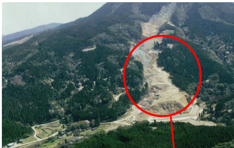
平成17～18年度 災害復旧溪間工施工状況 (宮崎森林管理署)