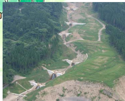
災害復旧状況 (平成20年3月撮影)

崩壊した山には、土砂の流出を防ぐ工作物や緑化などの治山事業を行い、早く森林にもどすようにします。