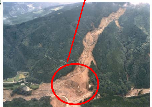
平成17年度 台風14号災害 (宮崎森林管理署)

崩壊した土砂は土石流となって流れ出し、 さらに被害を拡大させるおそれがあります。