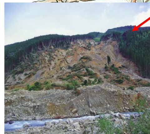
平成17年度 台風14号災害 (宮崎南部森林管理署)