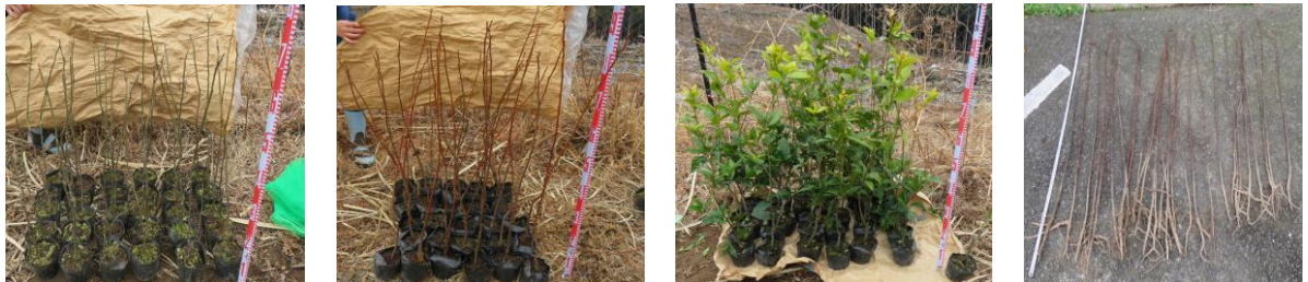
写真1. 左からセンダン、チャンチンモドキ、ハナガガシ、ケンポナシの苗木

センダン、チャンチンモドキ、ハナガガシについては、ポット苗を平成30年3月、ケンポナシについては、平成31年4月に裸苗を各樹種それぞれ植栽（1,300本/ha）し、樹高及び地際直径について成長休止期にそれぞれ計測した（写真1）。