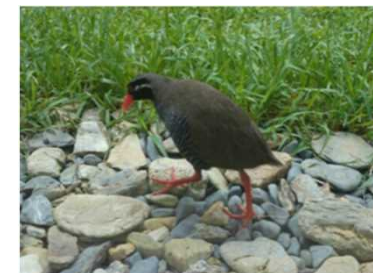
ヤンバルクイナ(国指定天然記念物ヤンバルクイナ)