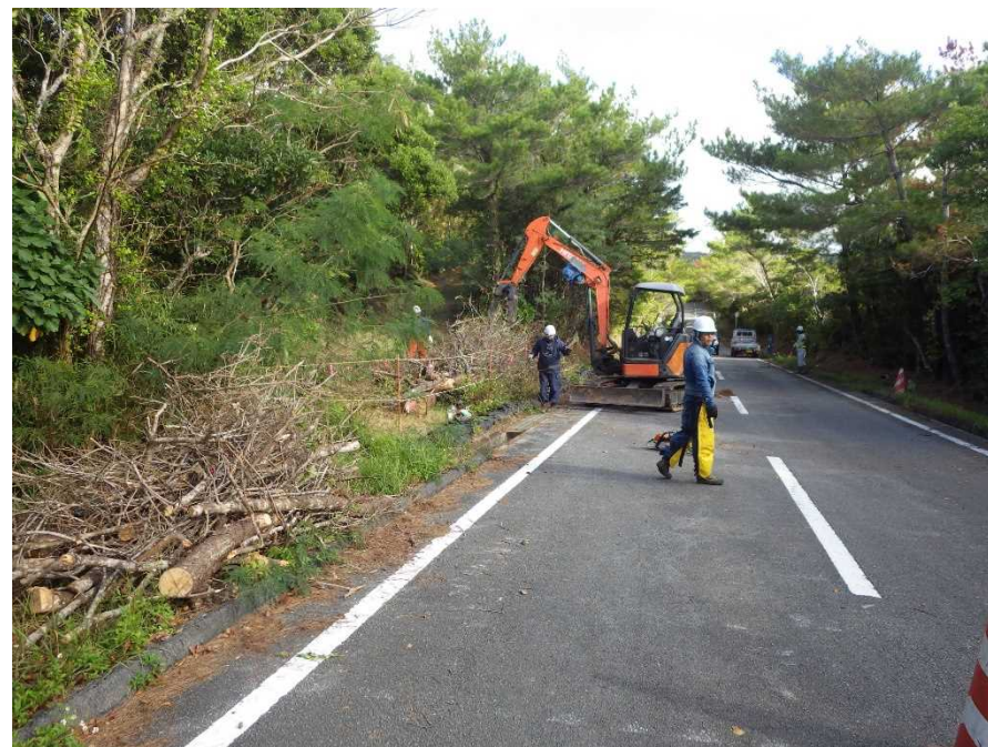
松くい虫被害の松を伐倒し防除対策に努める