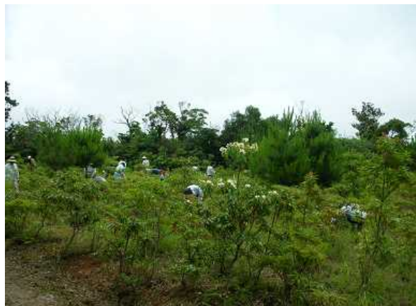
② 古事の森の下刈作業の様子