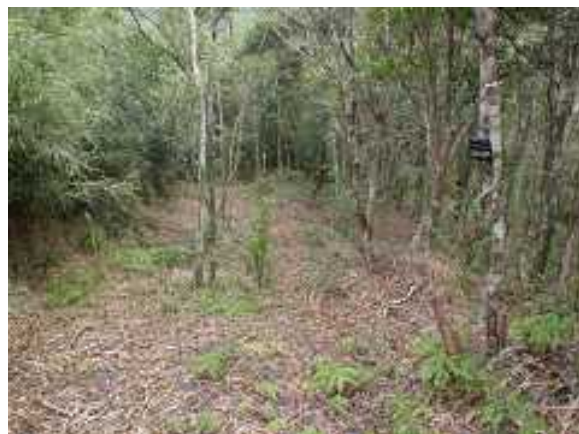
② 古事の森の林内の様子