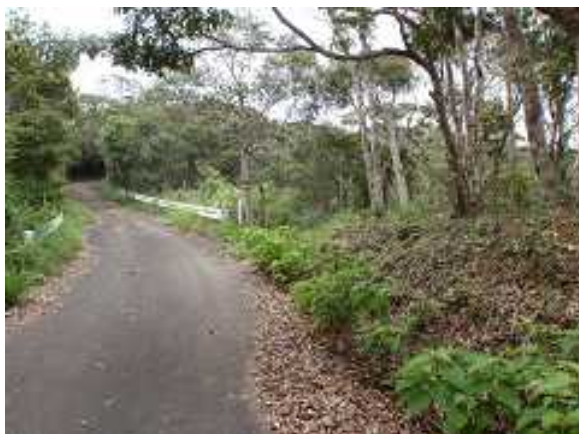
① 古事の森と接続路の様子