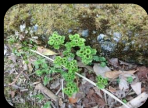
ヤマヌコノメソウ