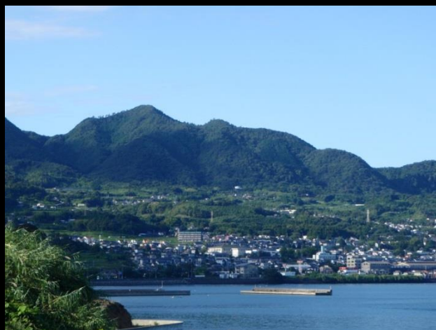
七ツ石山頂部の国有林