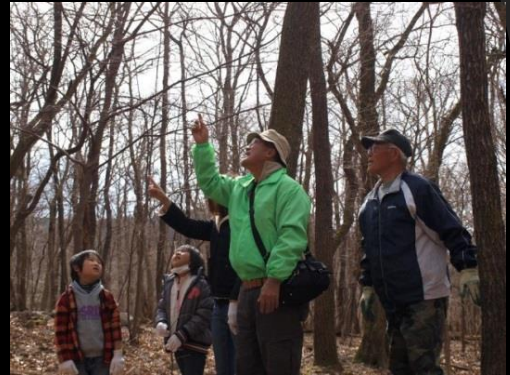
猪の瀬戸・遊々の森