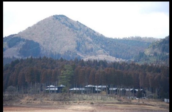
国土保全機能の発揮