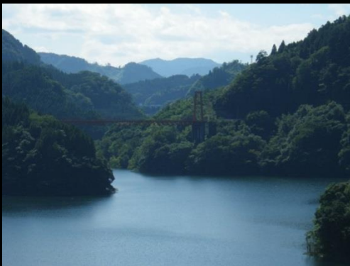
水資源を育む森林