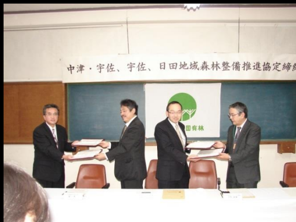
森林整備推進協定