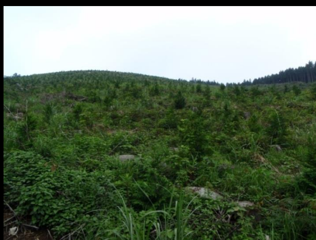
植樹し森林を維持