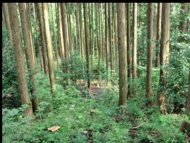
間伐期を迎えた森林