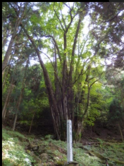
千本桂（大分県指定天然記念物）