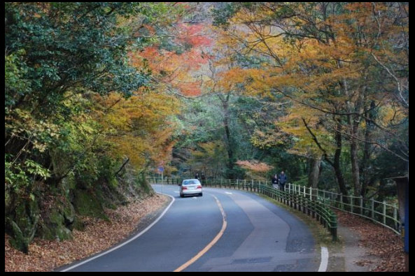
森林とふれあいの場