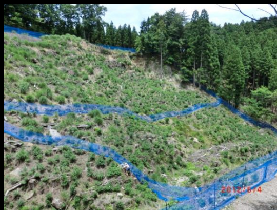
侵入防護柵の設置