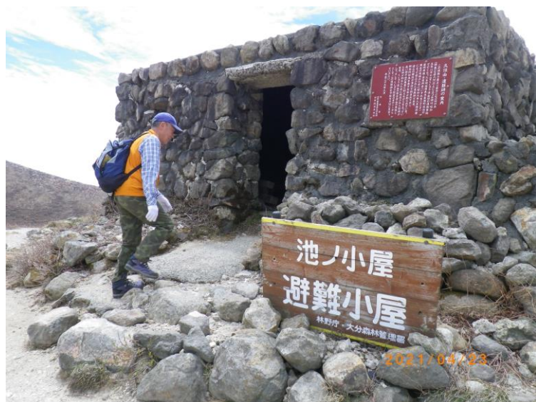
避難小屋の状況確認