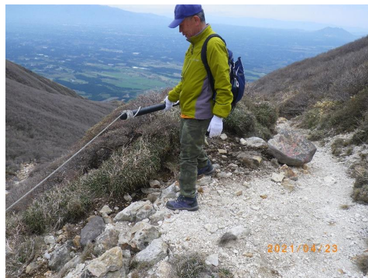
立入防止柵の簡易補修