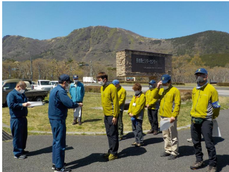
森林保護員任命式