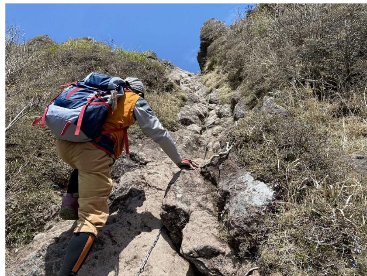
登山道等の状況確認