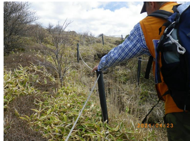
立入防止柵の点検