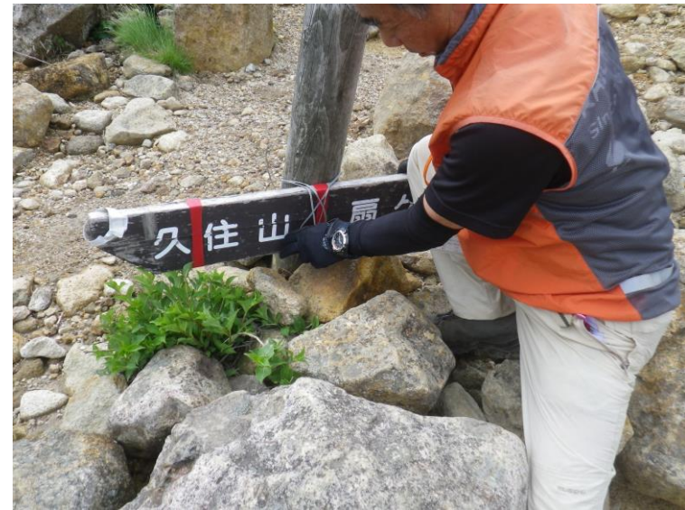
案内板の簡易補修