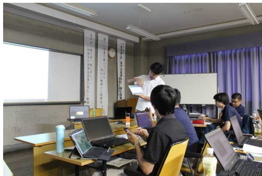
タブレットPCでの活用方法の講義