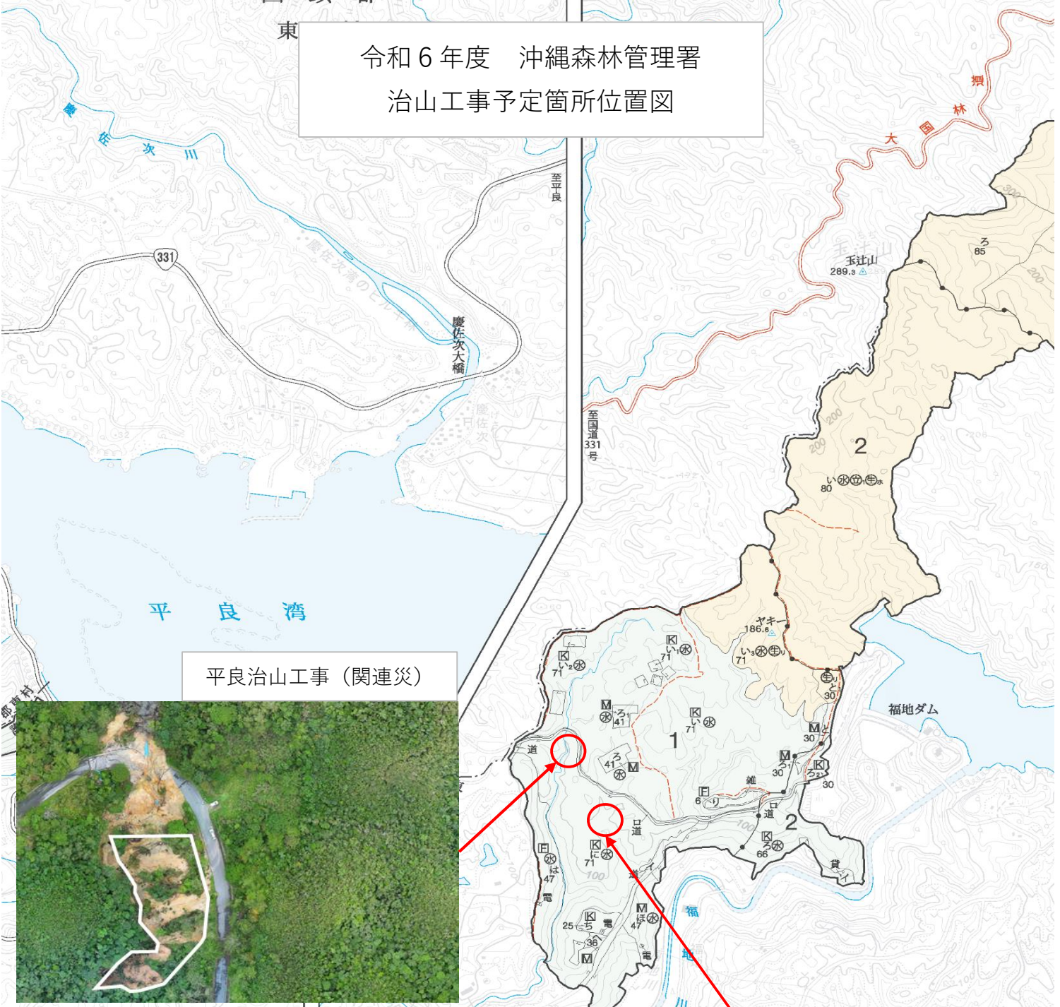
平良治山工事（関連災）