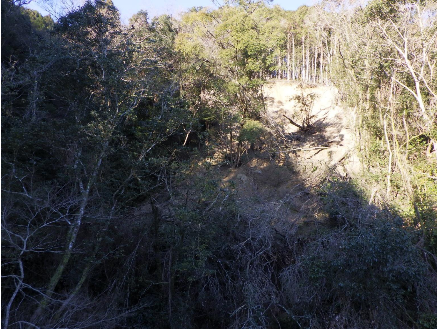
計画箇所 の 状況