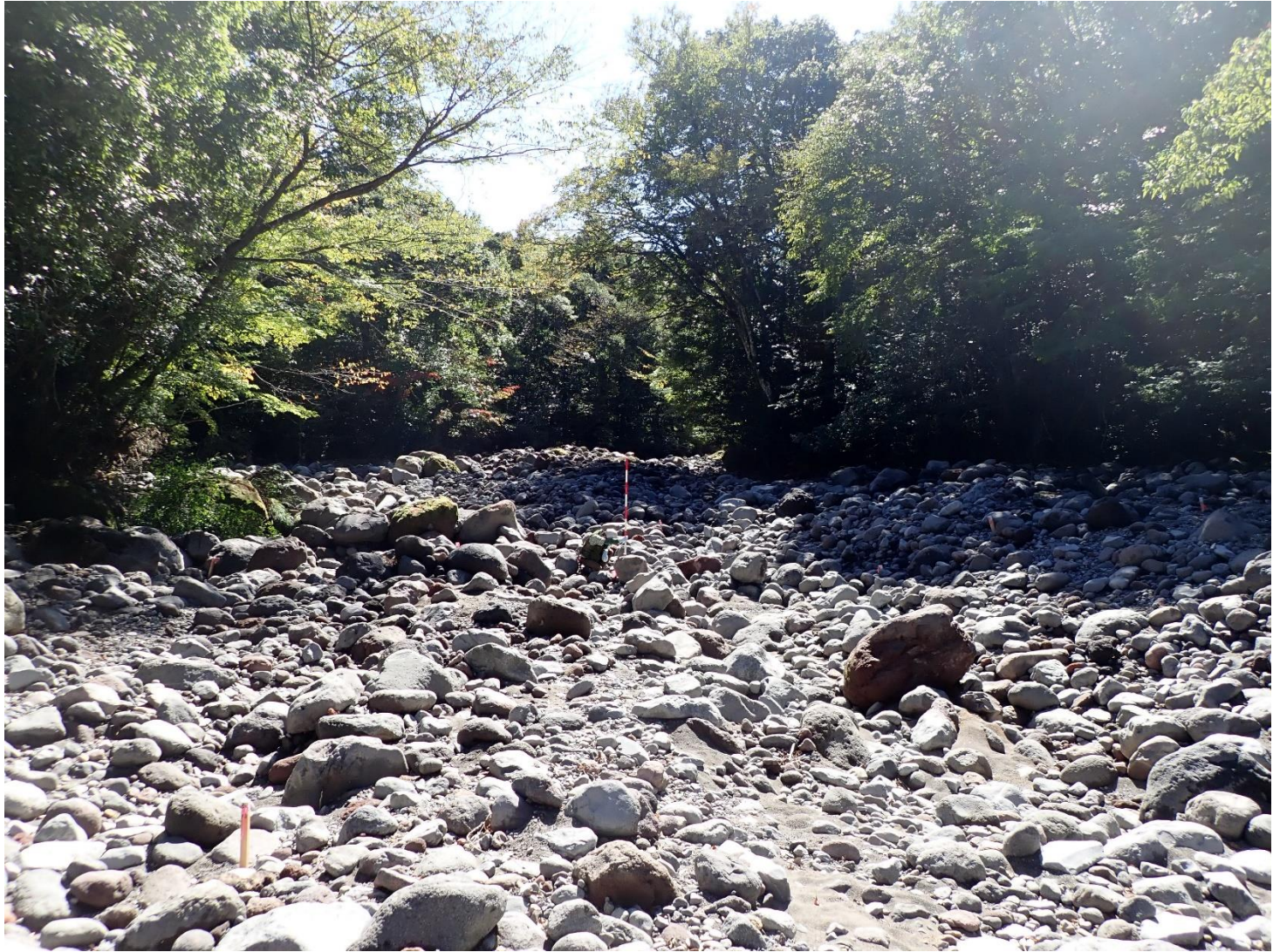
計画箇所 の 状況