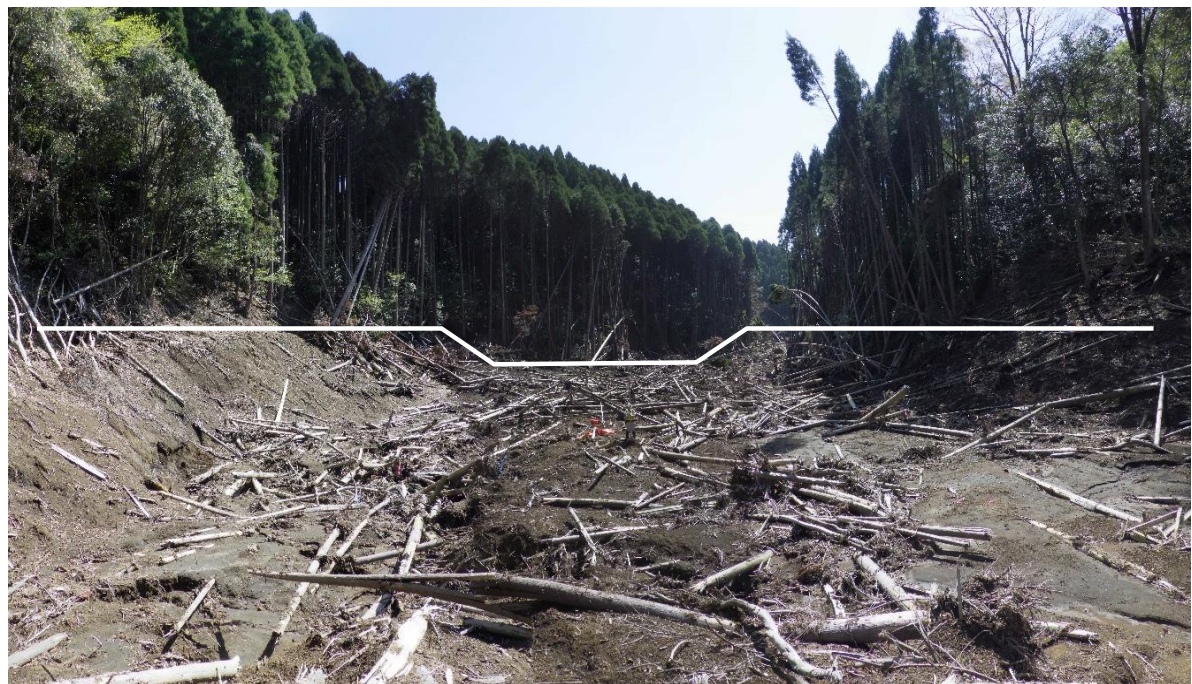
No.1コンクリート谷止工(No26計画下流から)の状況