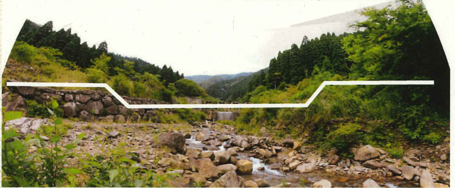
本田野 (67-1) 治山工事