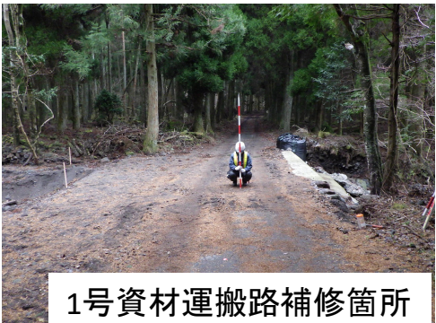
1号資材運搬路補修箇所