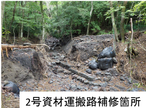
2号資材運搬路補修箇所