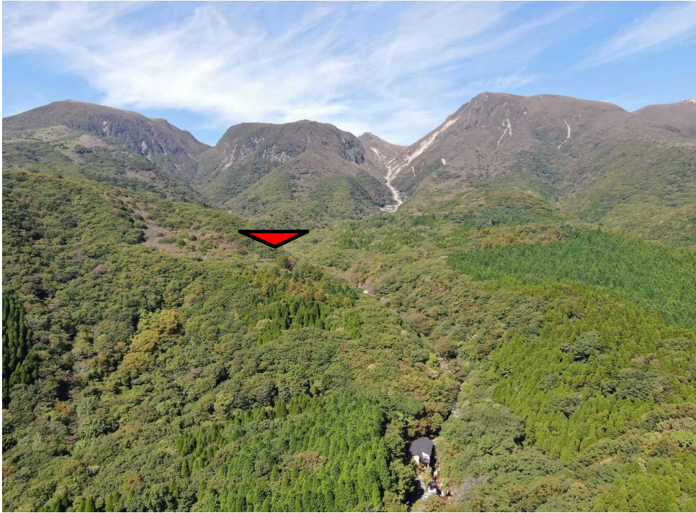
計画箇所全景の状況