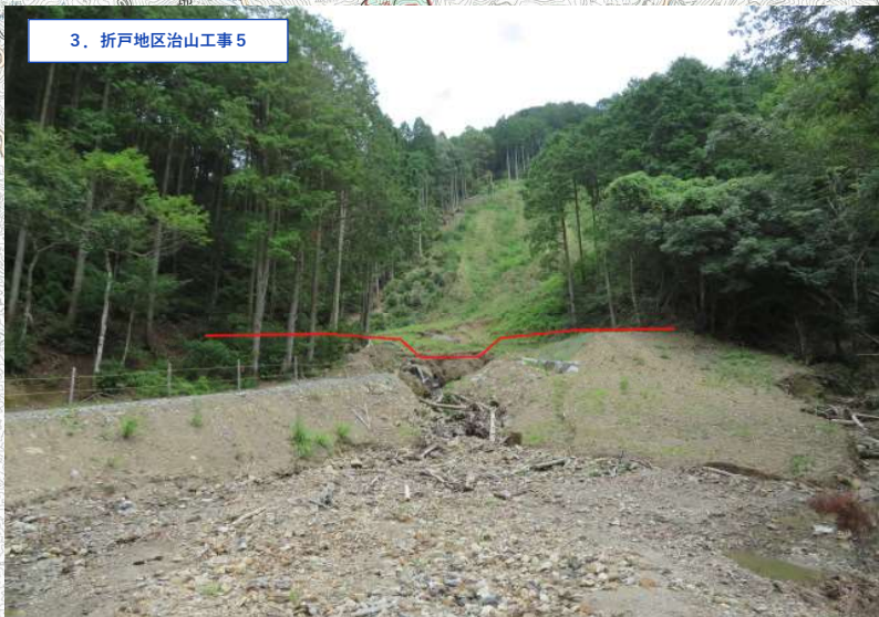
3. 折戸地区治山工事5