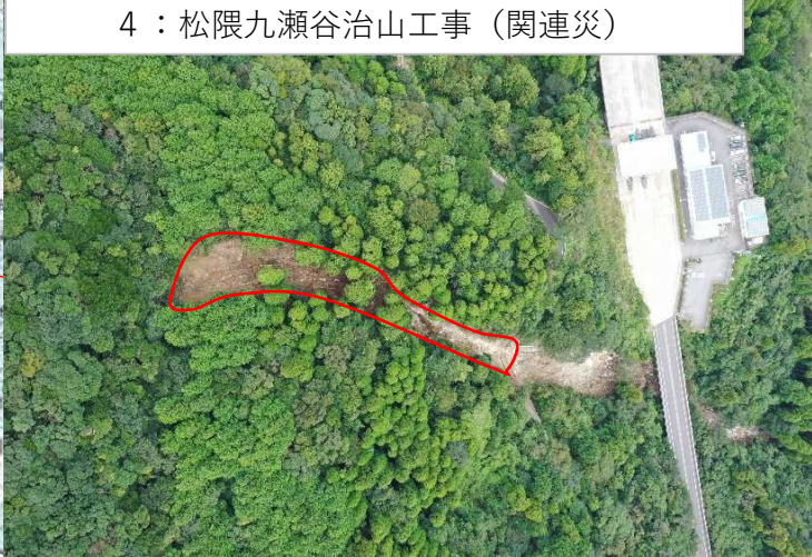
4：松隈九瀬谷治山工事（関連災）