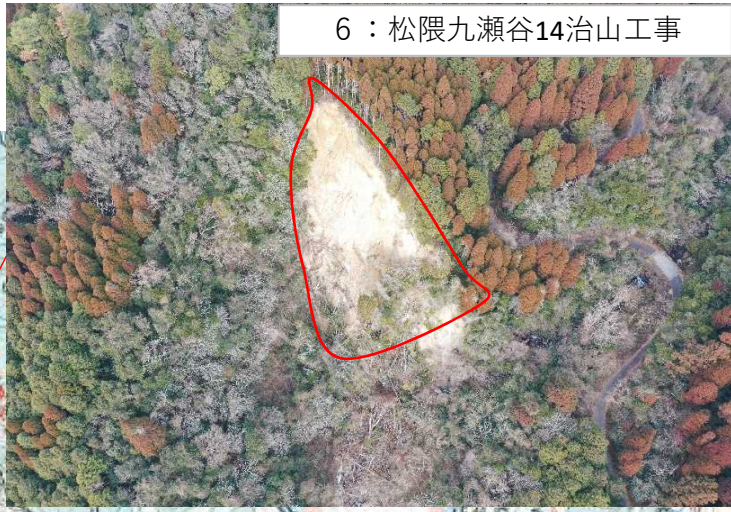
6：松隈九瀬谷14治山工事