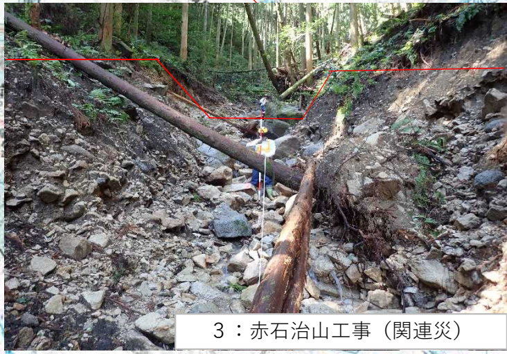
3：赤石治山工事（関連災）