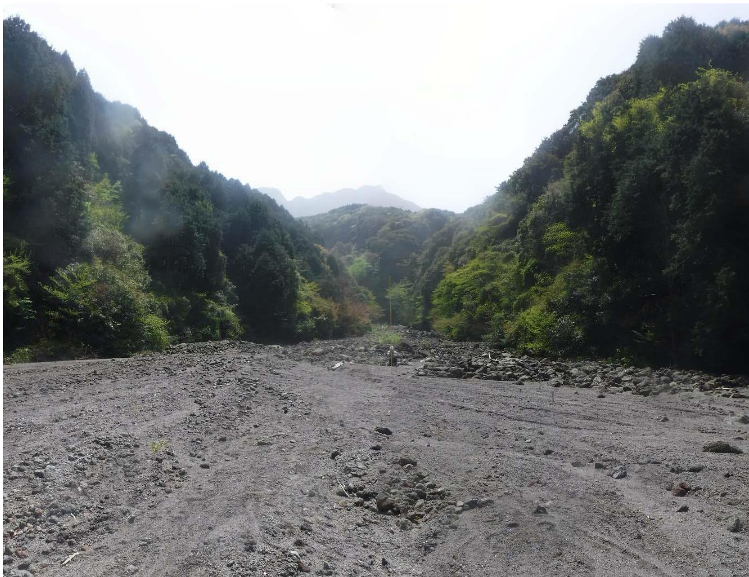
No.1 谷止工計画地の状況(下流から)