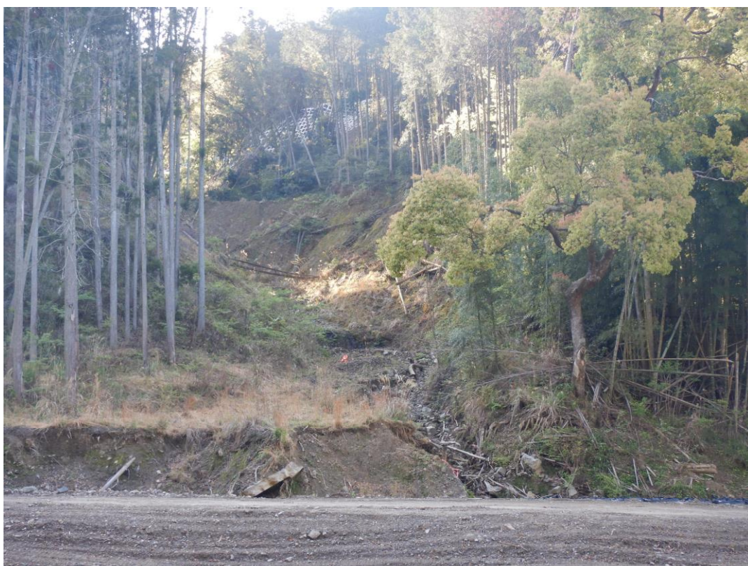
須川 6 地区計画地の全景状況