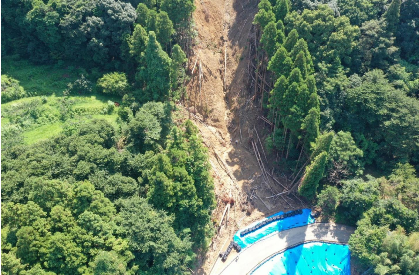
崩壊地下部(支線との合流部付近)