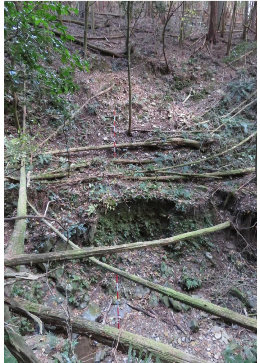
No1谷止工計画地 左岸の状況