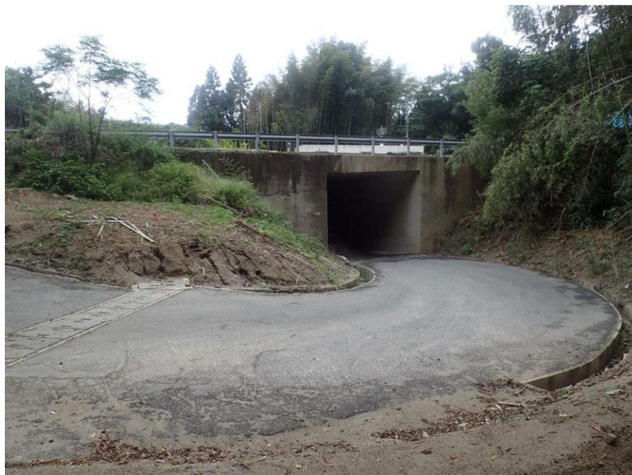
003_保全対象(市道、高速道路)