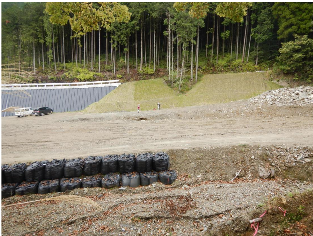
保全対象 主要地方道朝倉小石原線の状況