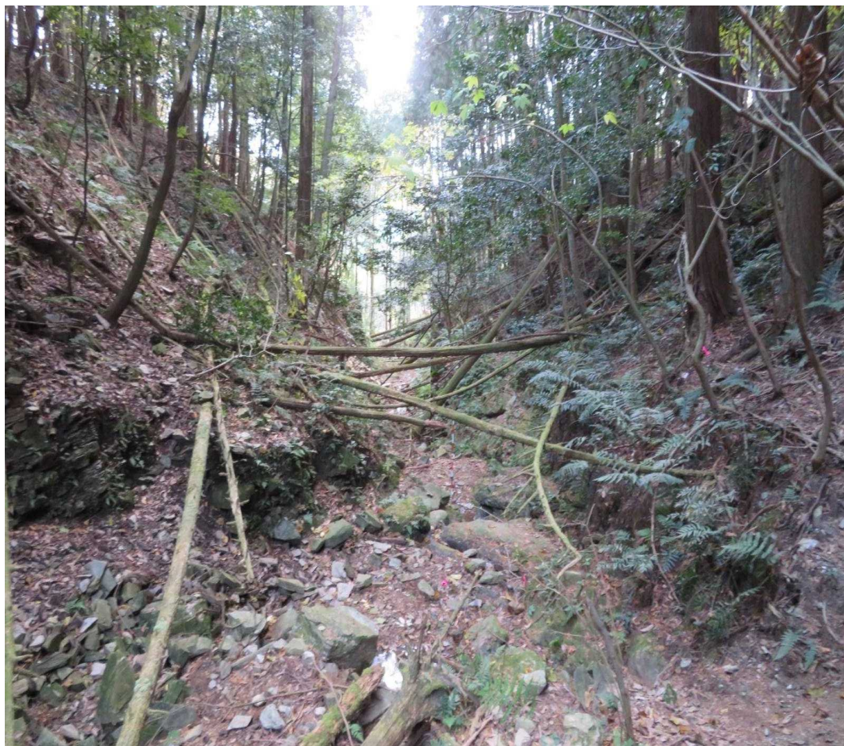
測点No27 No1谷止工計画地(上流側より)