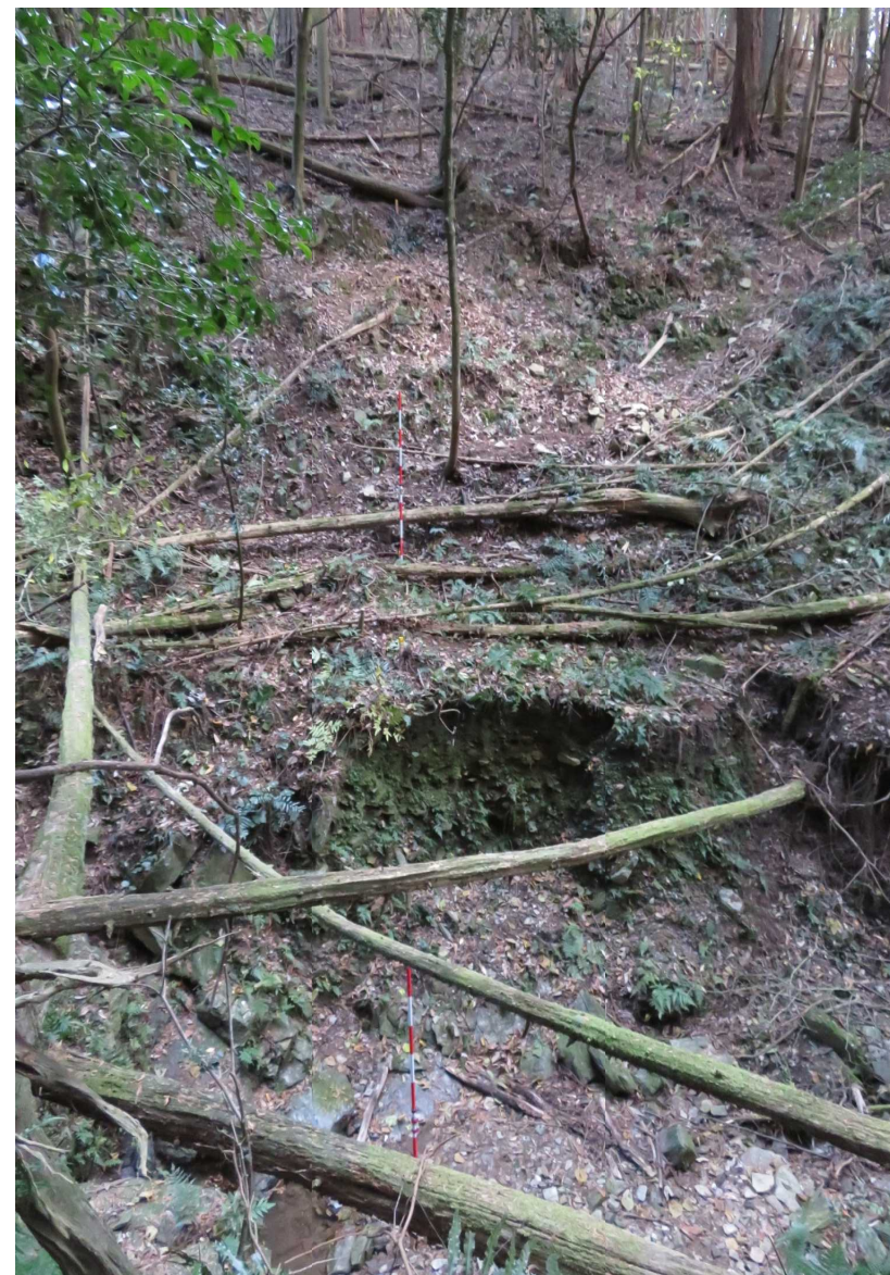
No1谷止工計画地 左岸の状況