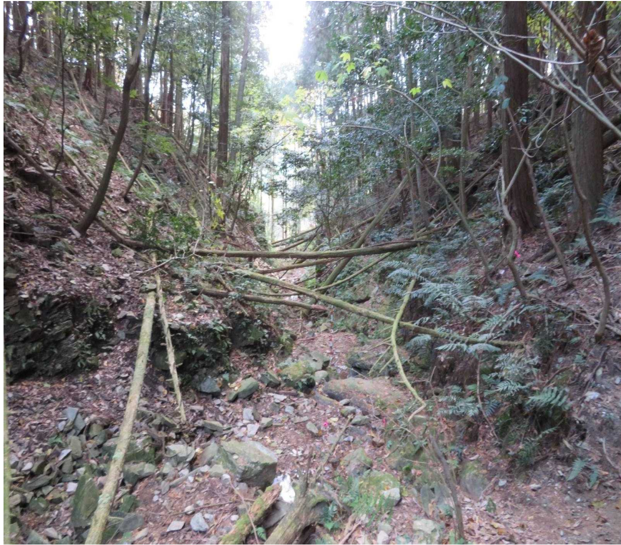
測点No27 No1谷止工計画地(上流側より)