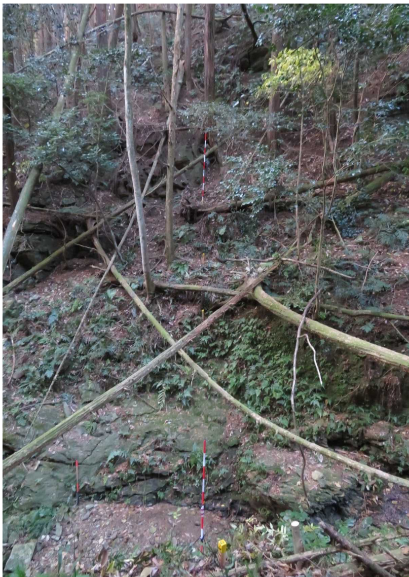
No1谷止工計画地 右岸の状況