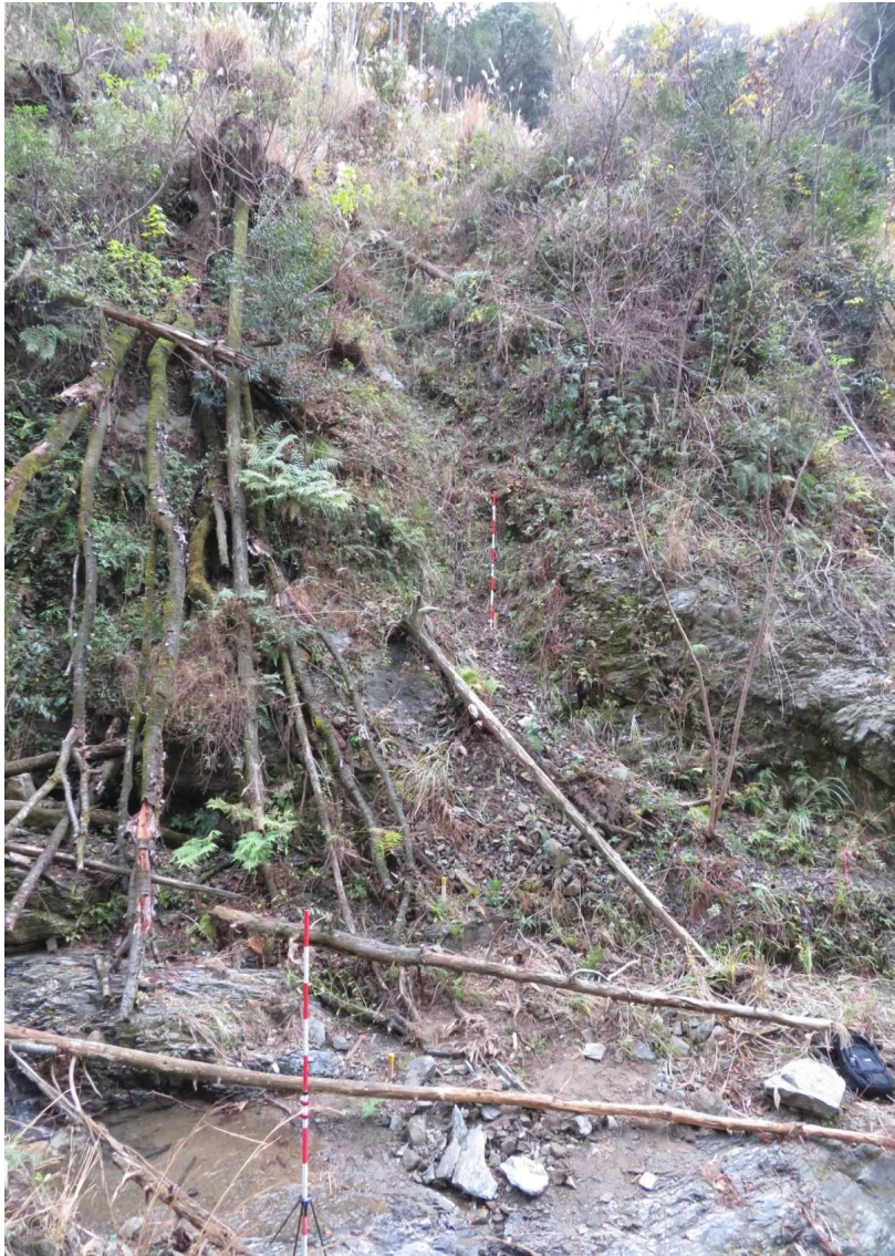
測点 No.23 左岸の状況