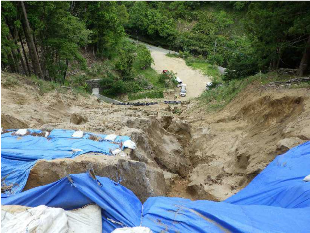
山腹の状況(測点No.22 から下流)