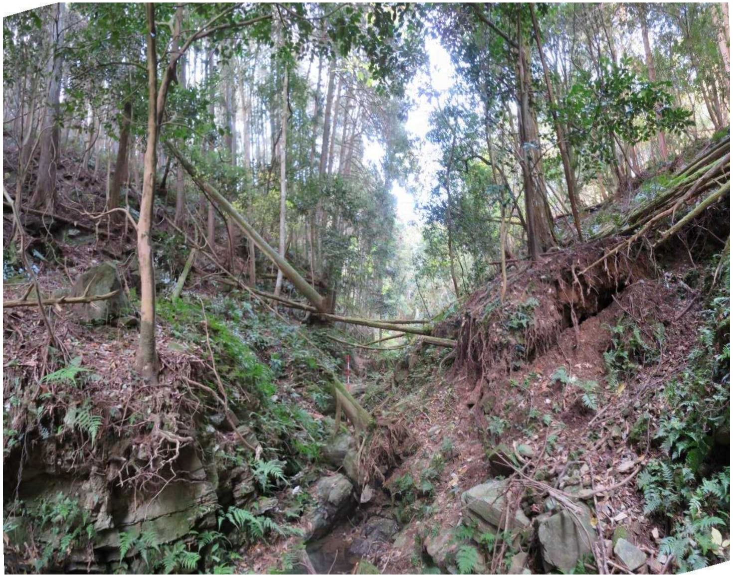
測点No27 No1谷止工計画地