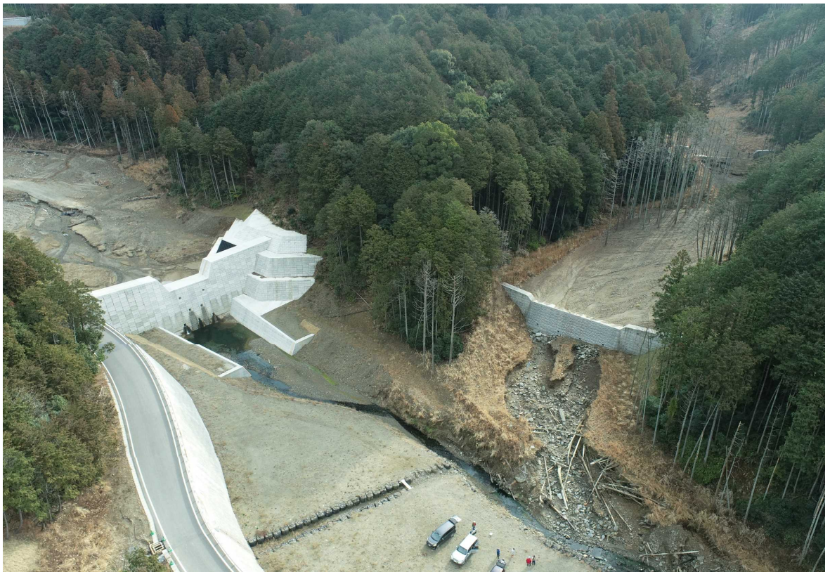
計画地全景と妙見川砂防ダム