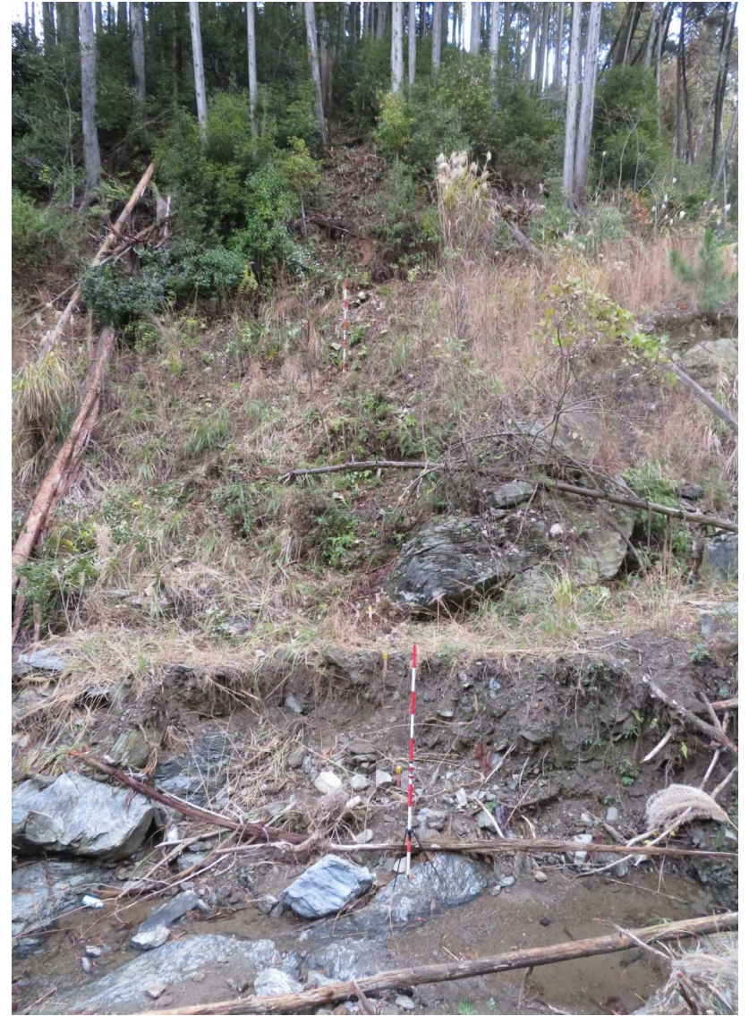
測点 No.23 右岸の状況