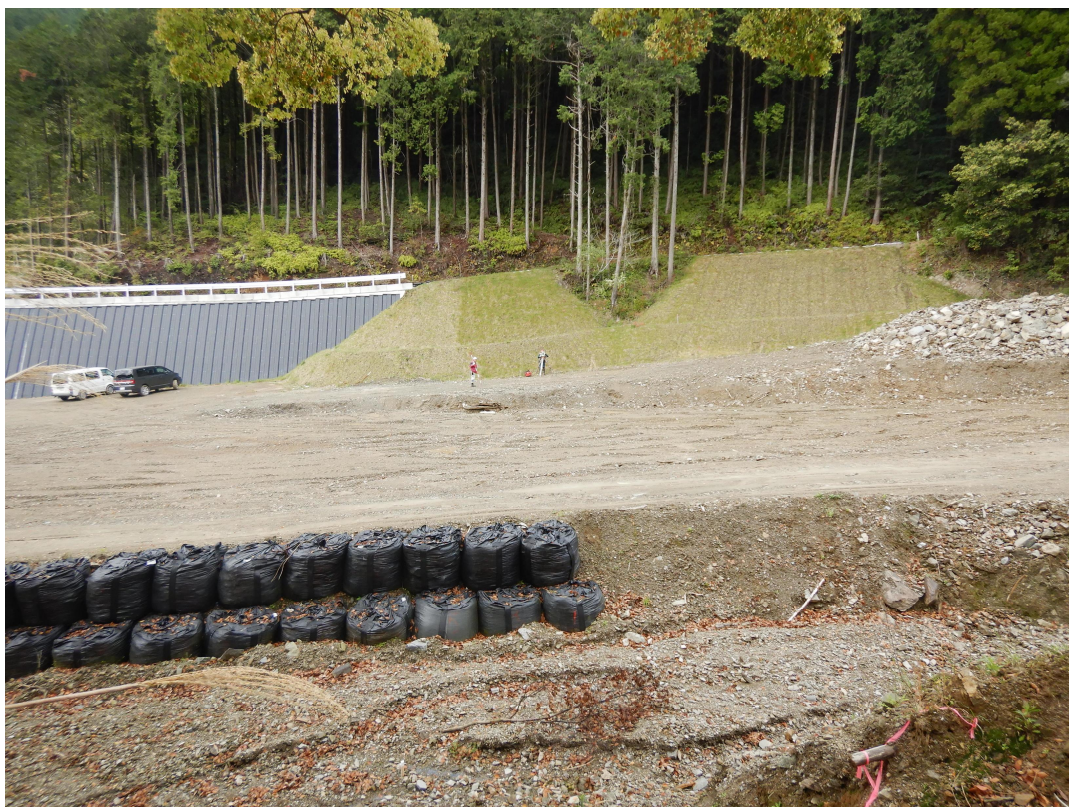
保全対象 主要地方道朝倉小石原線の状況