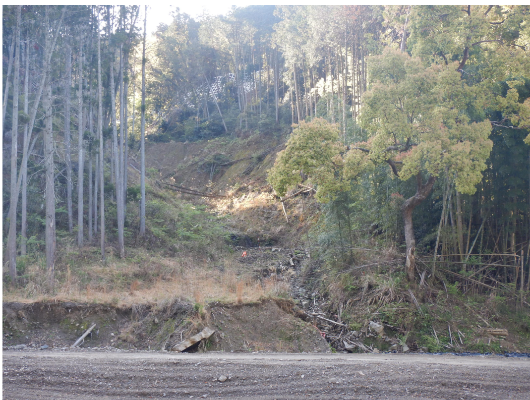
須川6地区計画地の全景状況