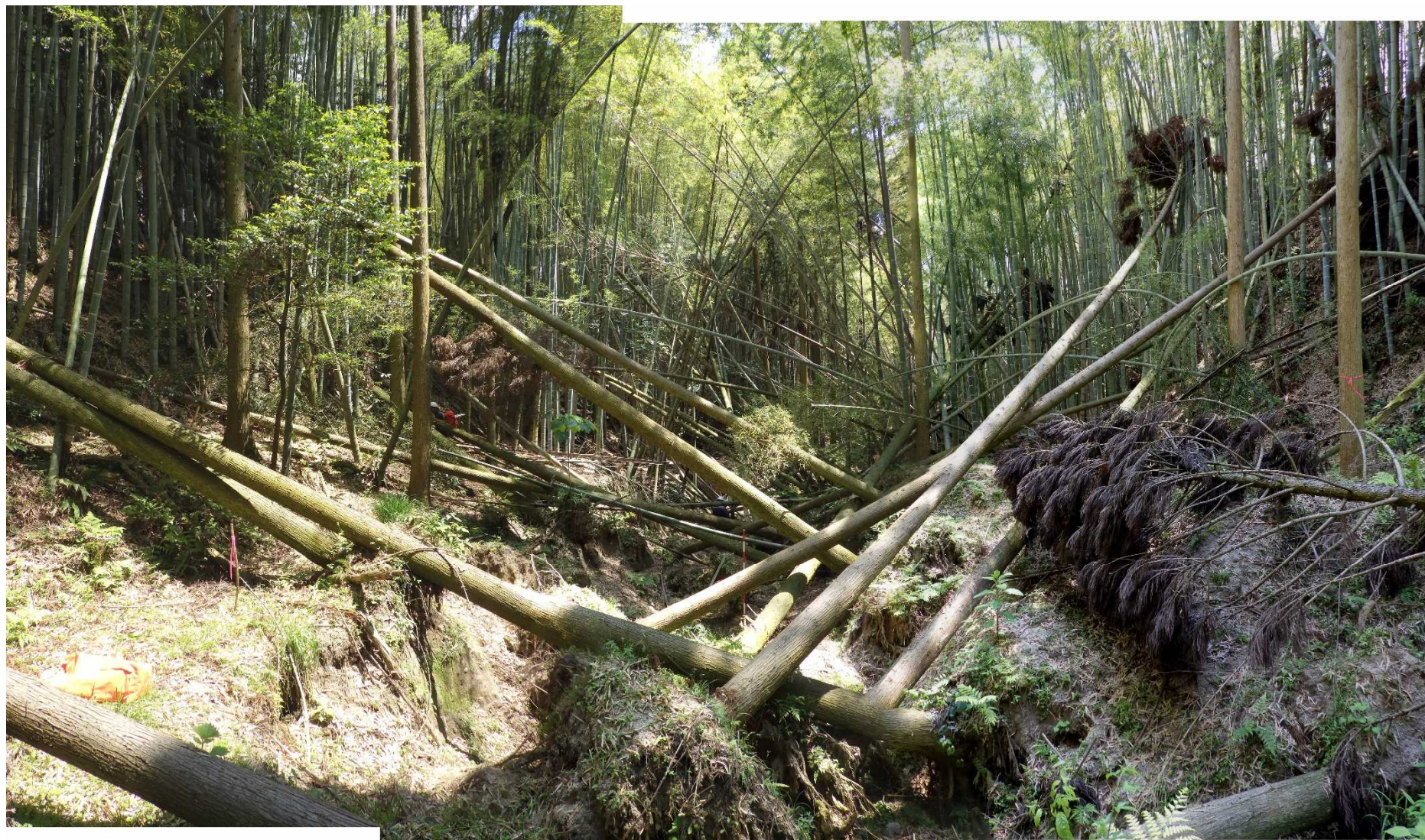
No.1 谷止工計画位置 (上流から)