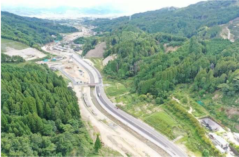
03計画地下流域の赤谷川及び保全対象の状況 DJI_0132