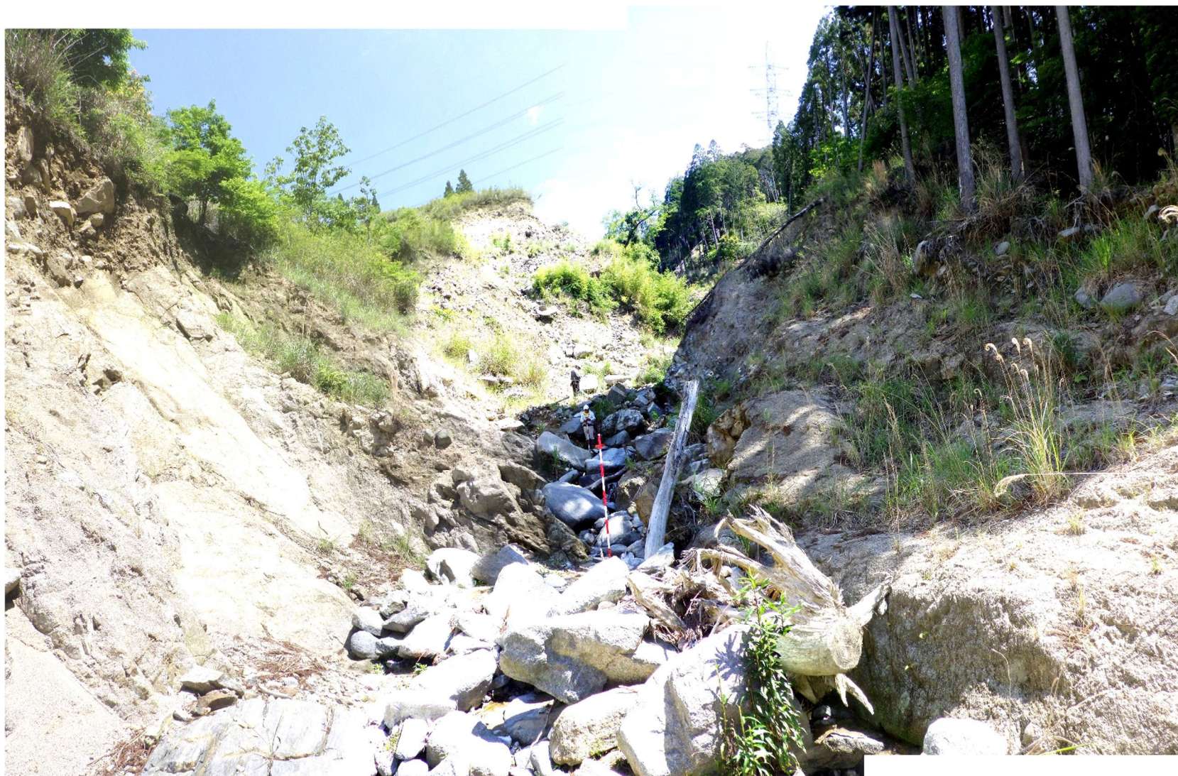
No.1 谷止工計画位置 (下流から)