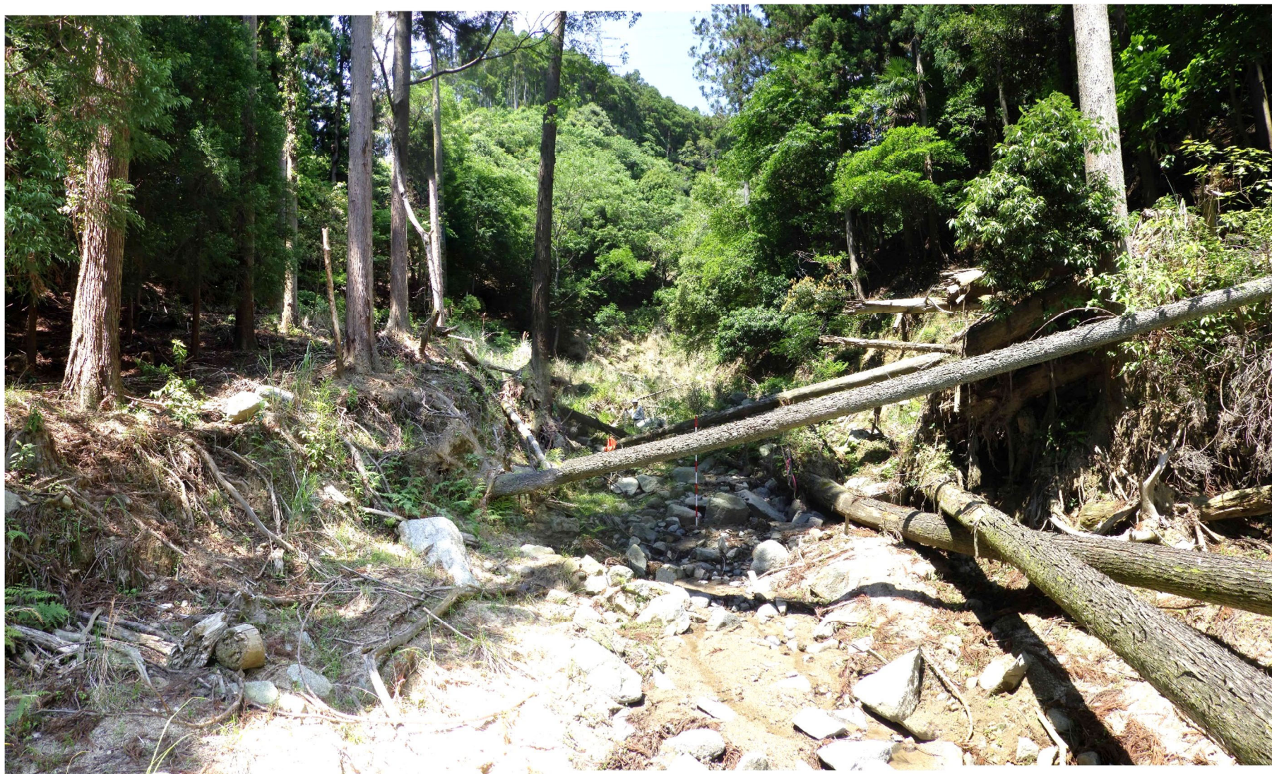
No.1 谷止工計画位置 (下流から)