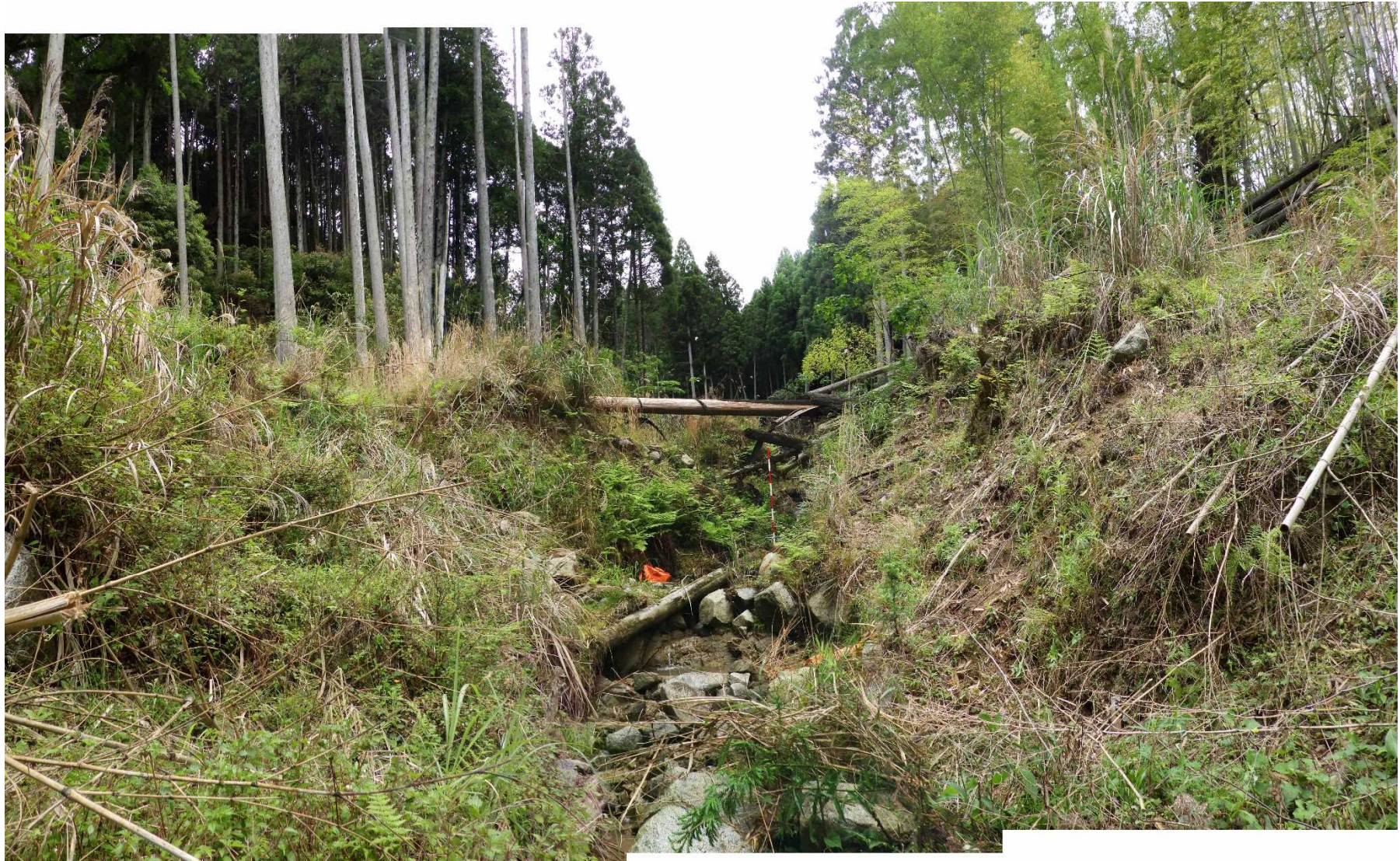
No.1 谷止工計画位置 (下流から)