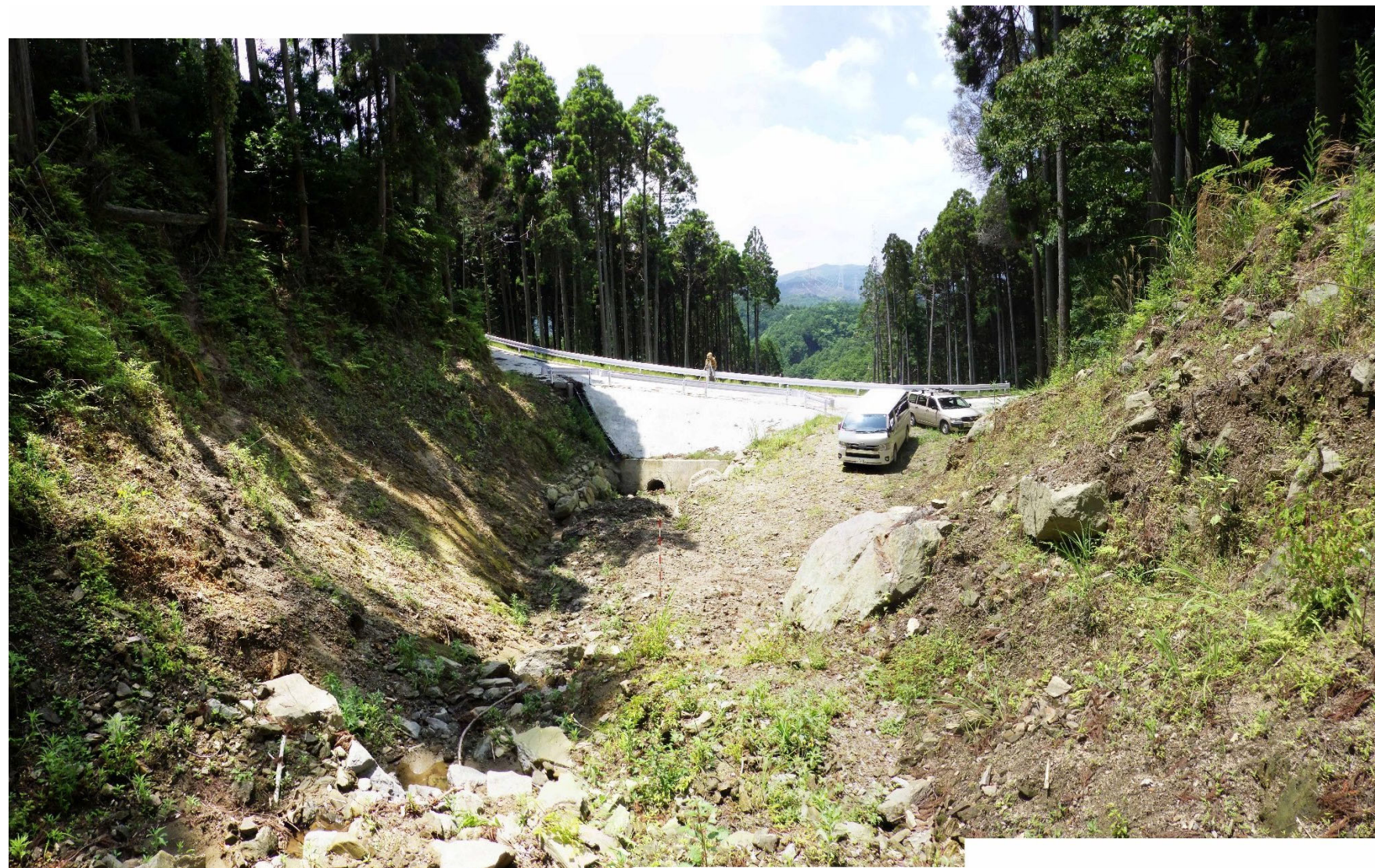
No.1 谷止工計画位置 (上流から)