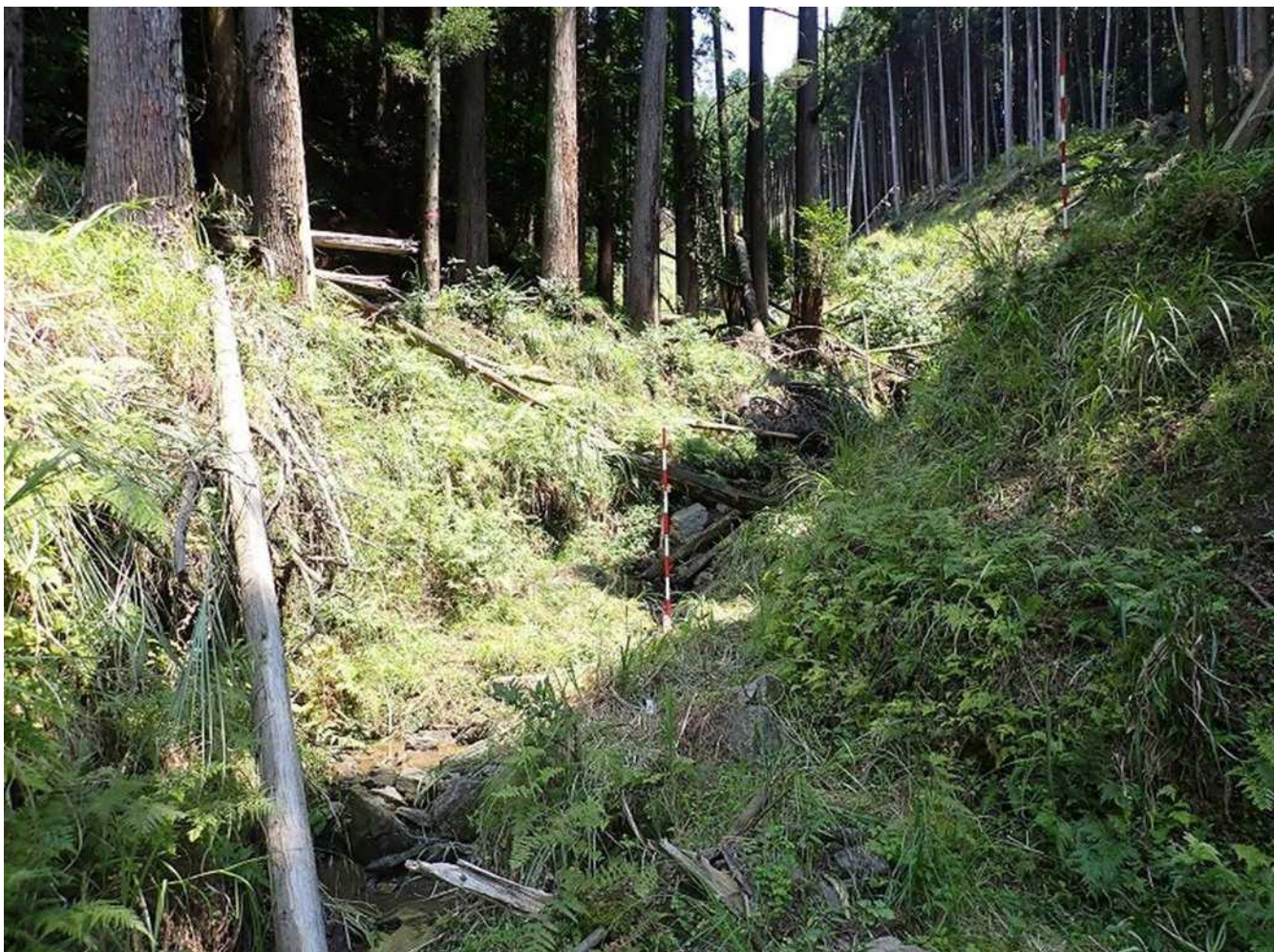
No.1床固工計画箇所(下流から) P7261693