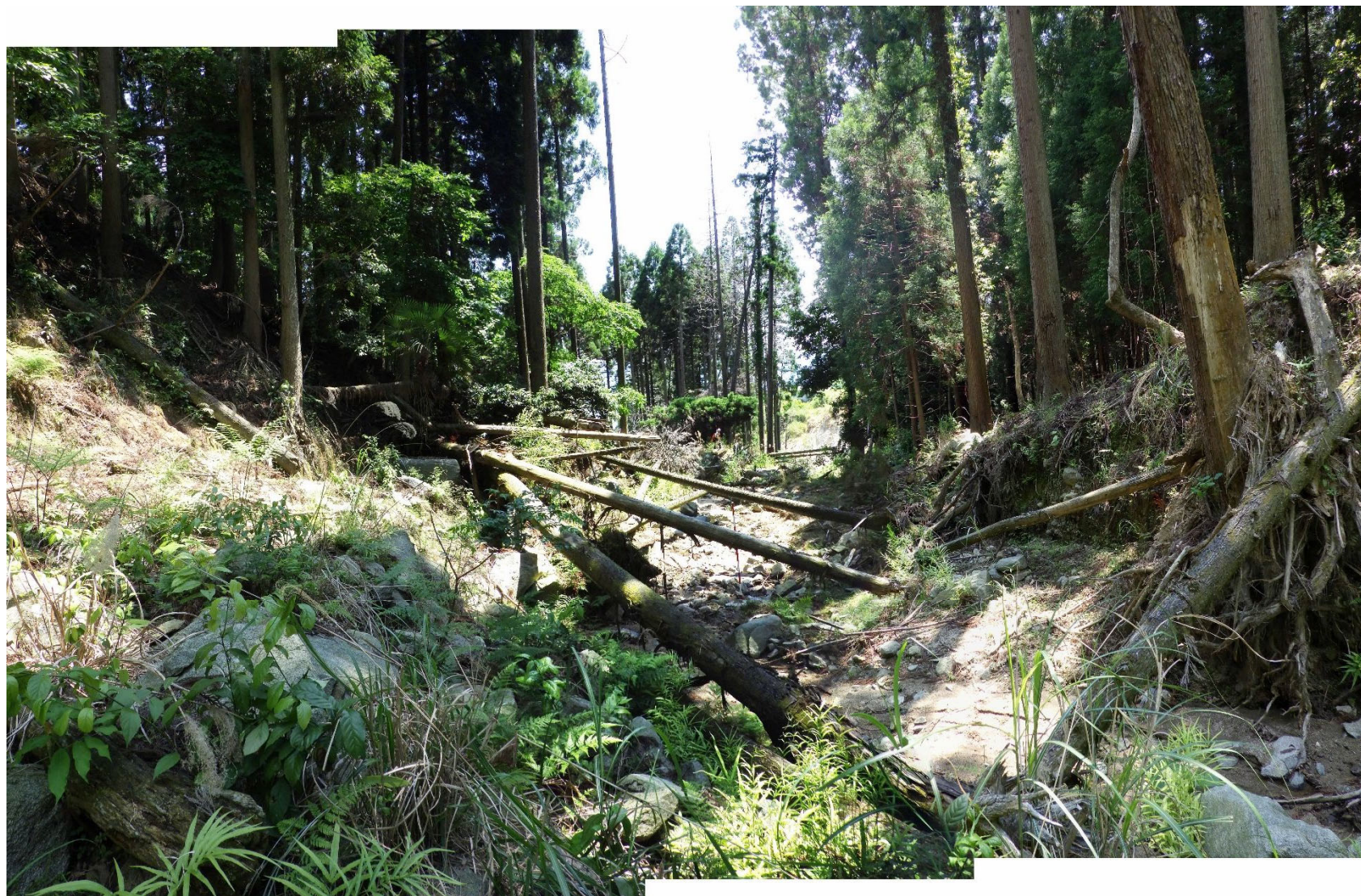
No.1 谷止工計画位置 (上流から)