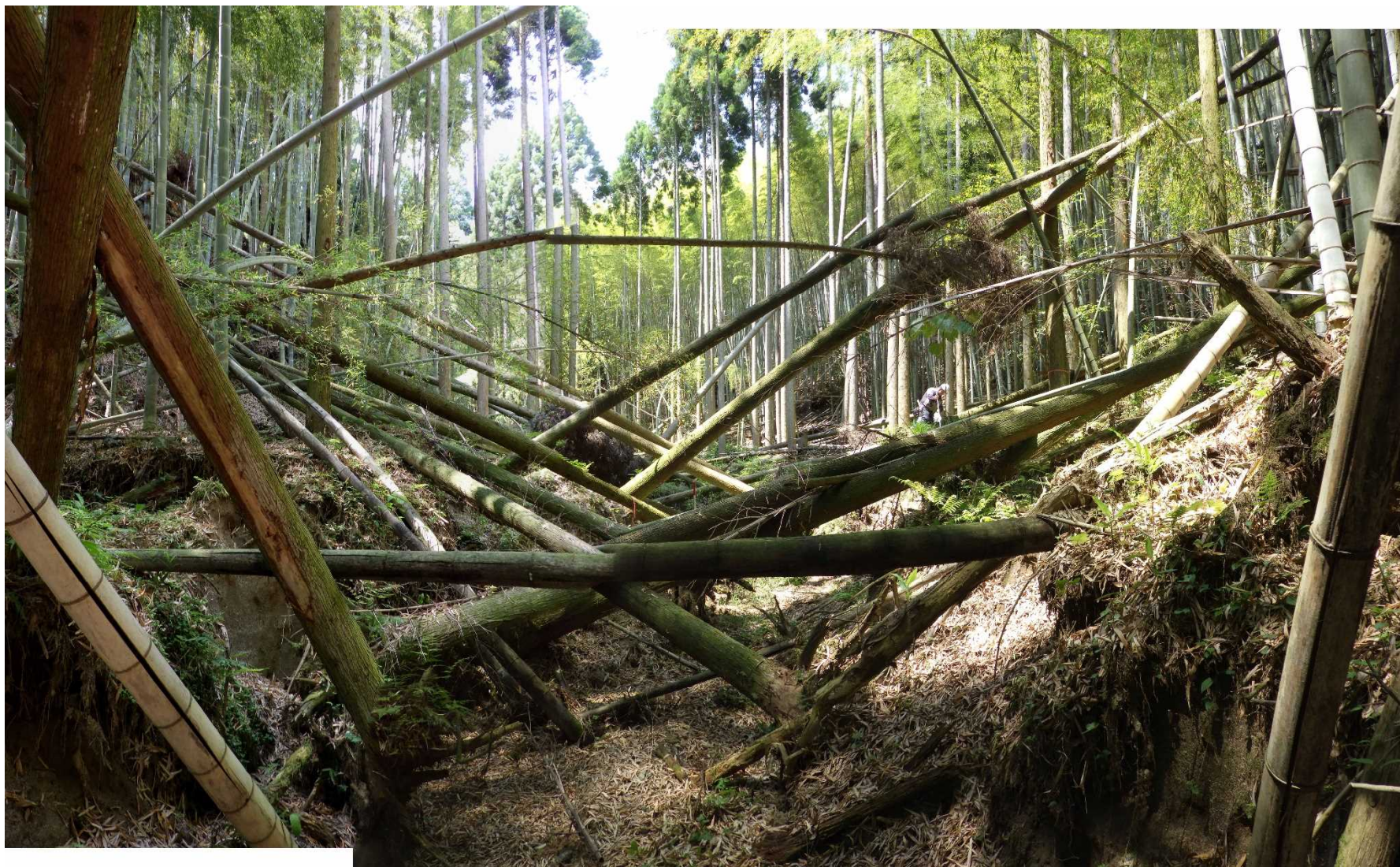
No.1 谷止工計画位置 (下流から)