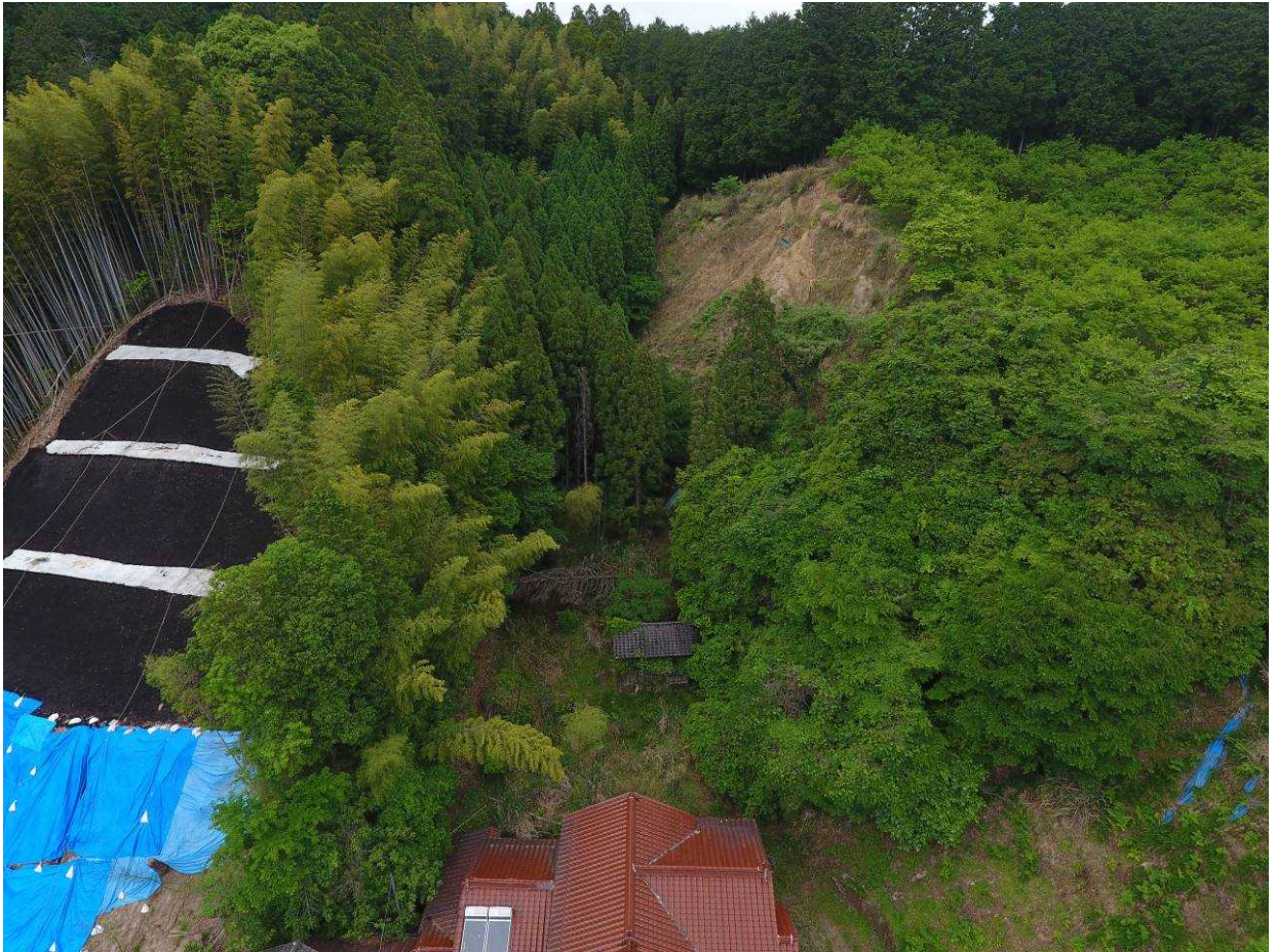
3 上空より計画地付近の状況 (DJI_0289jpg)