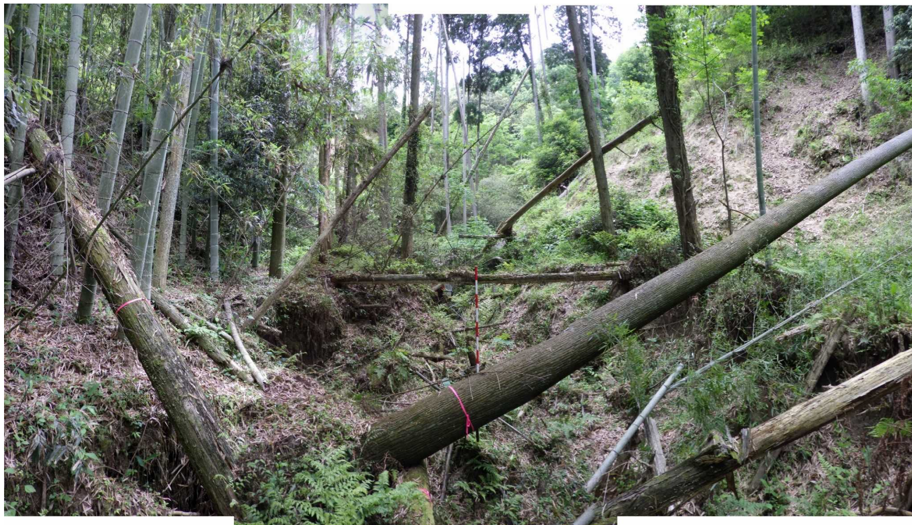
No.2 谷止工計画位置 (下流から)