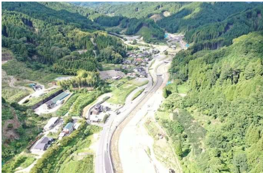
02 計画地下流域の赤谷川(上流)状況 DJI_0131