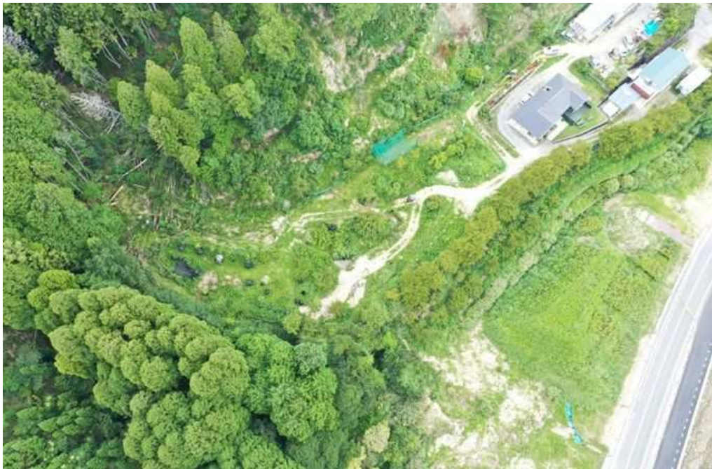
04計画地下流の荒廃状況 DJI_0138