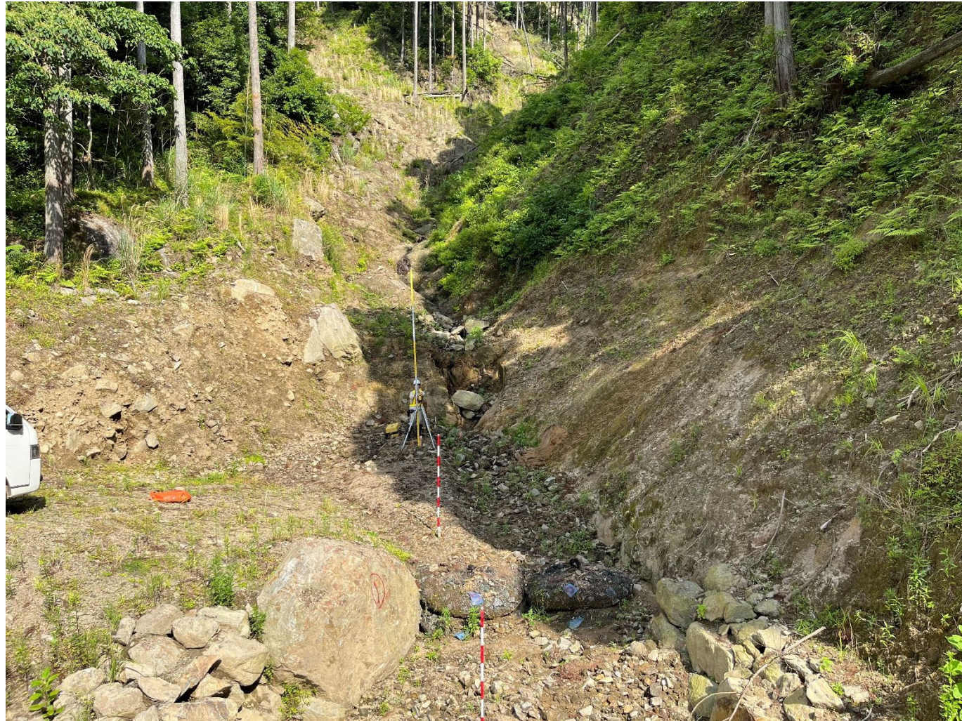
垂直壁計画位置 (下流から)