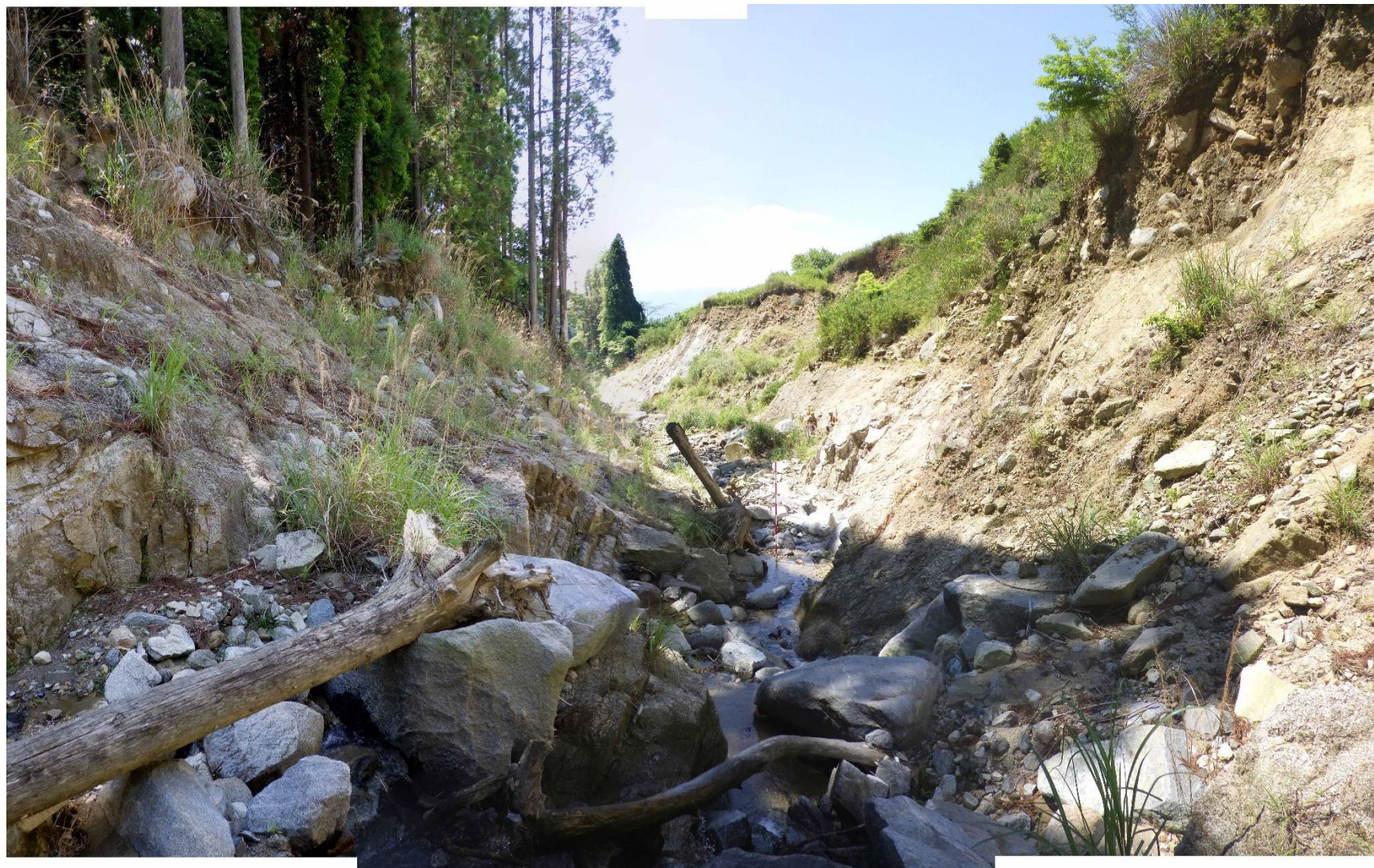
No.1 谷止工計画位置 (上流から)