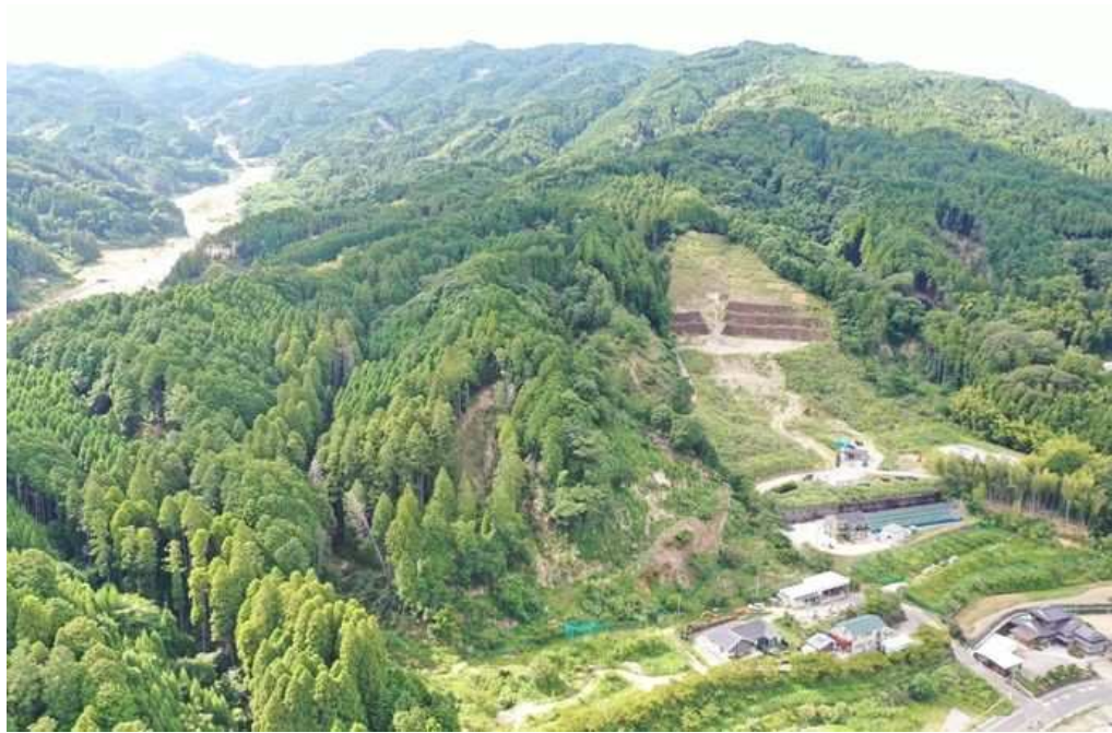
01 計画地上流域の遠景の状況 DJI_0130