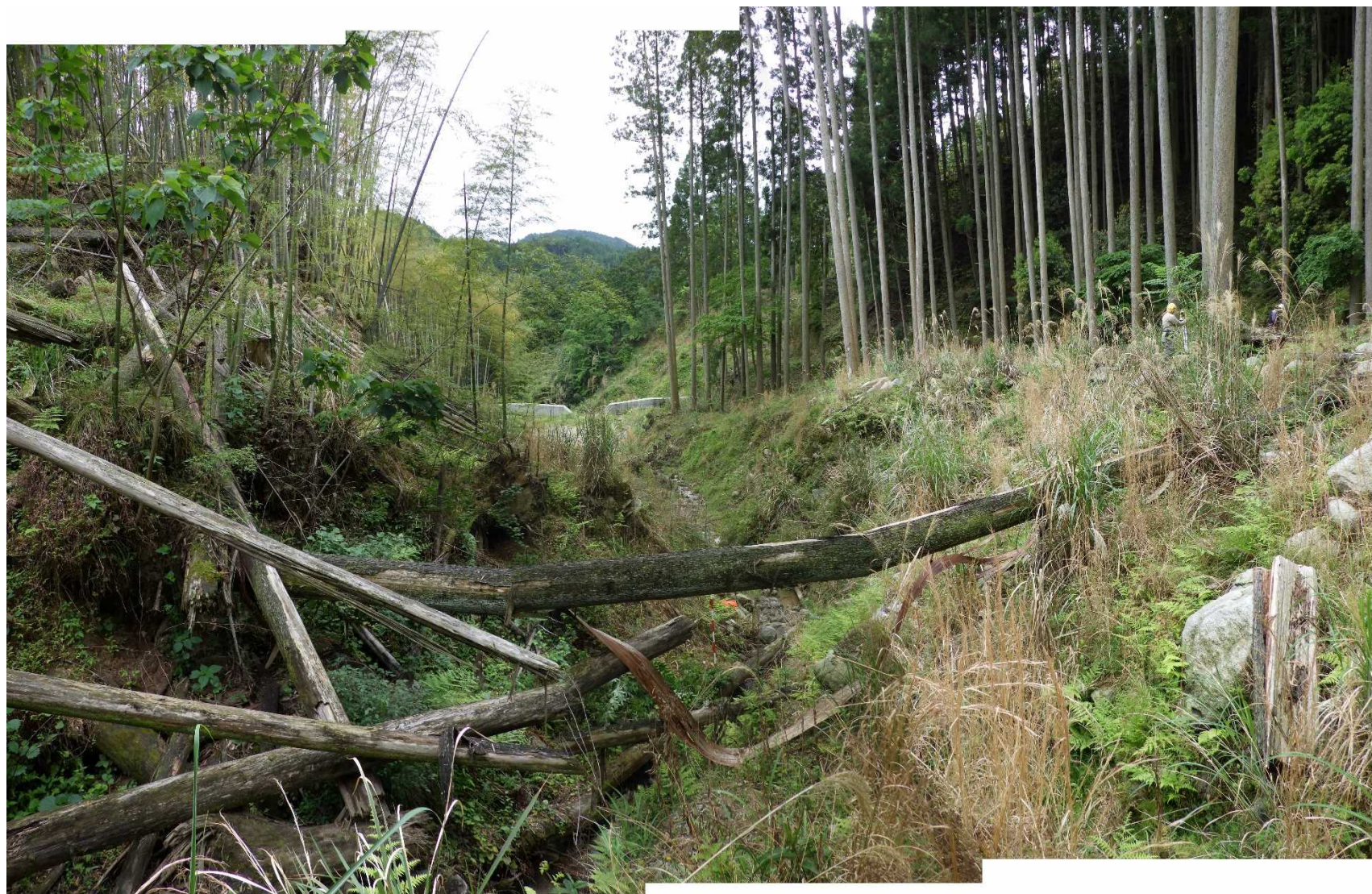
No.1 谷止工計画位置 (上流から)