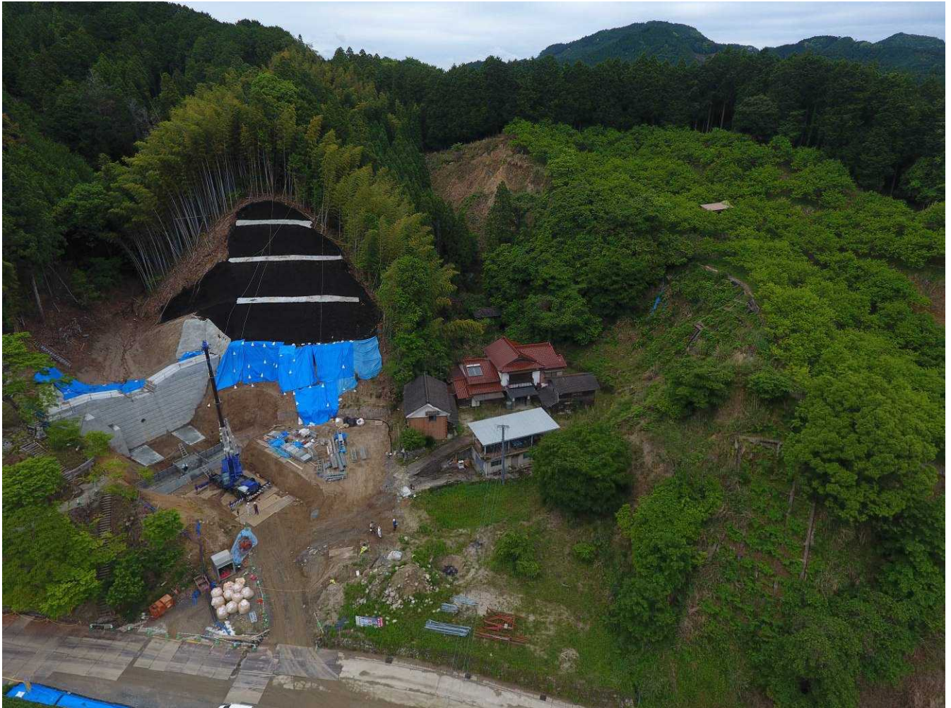
2 上空より計画地周辺の状況 (DJI_294.jpg)