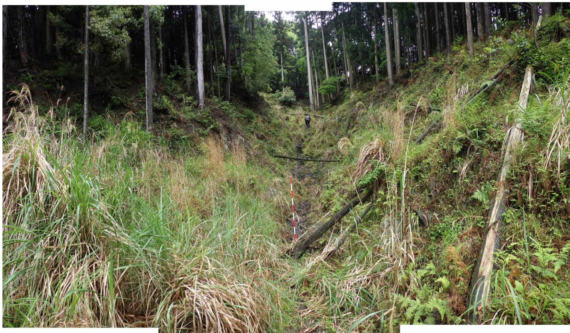
No.1 谷止工計画位置 (下流から)