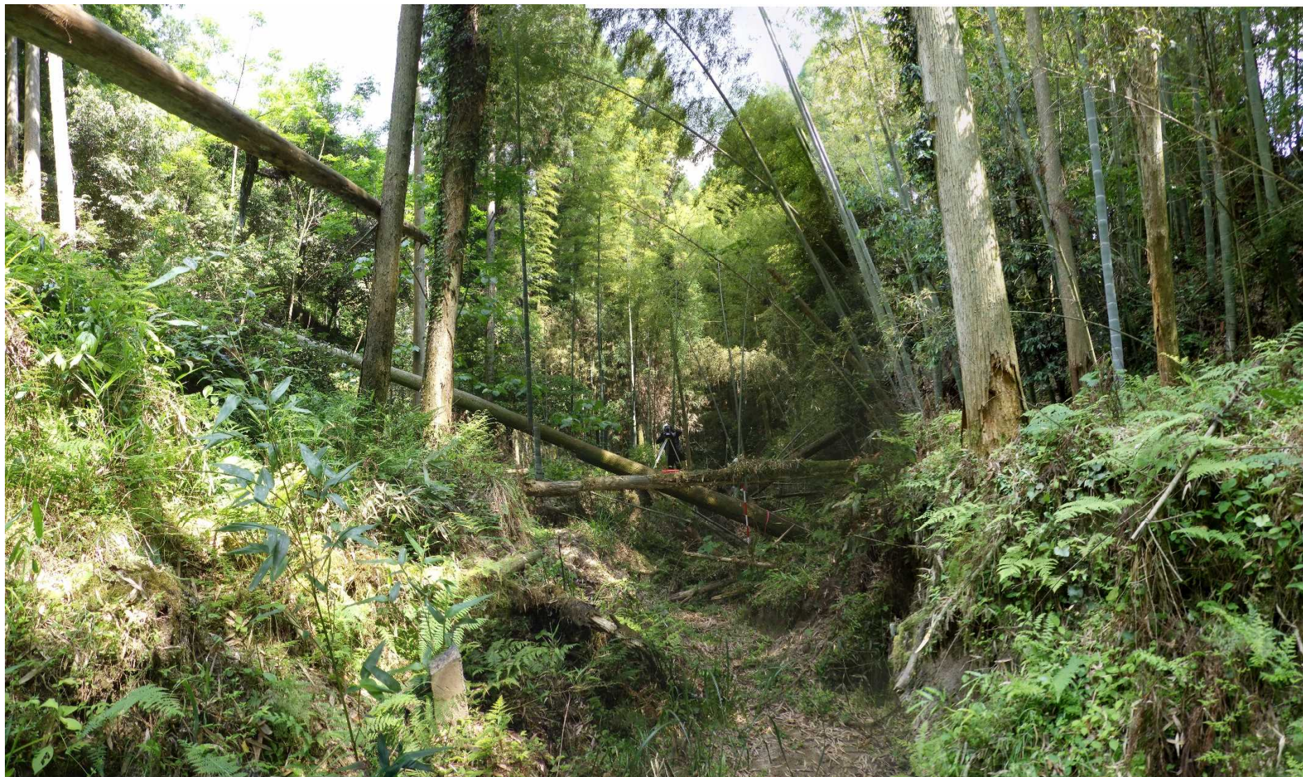
No.2 谷止工計画位置 (下流から)