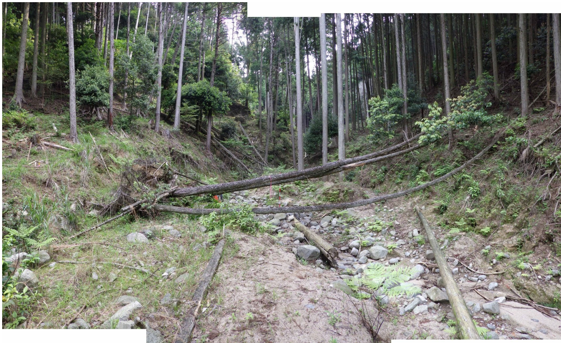
No.1 谷止工計画位置 (下流から)