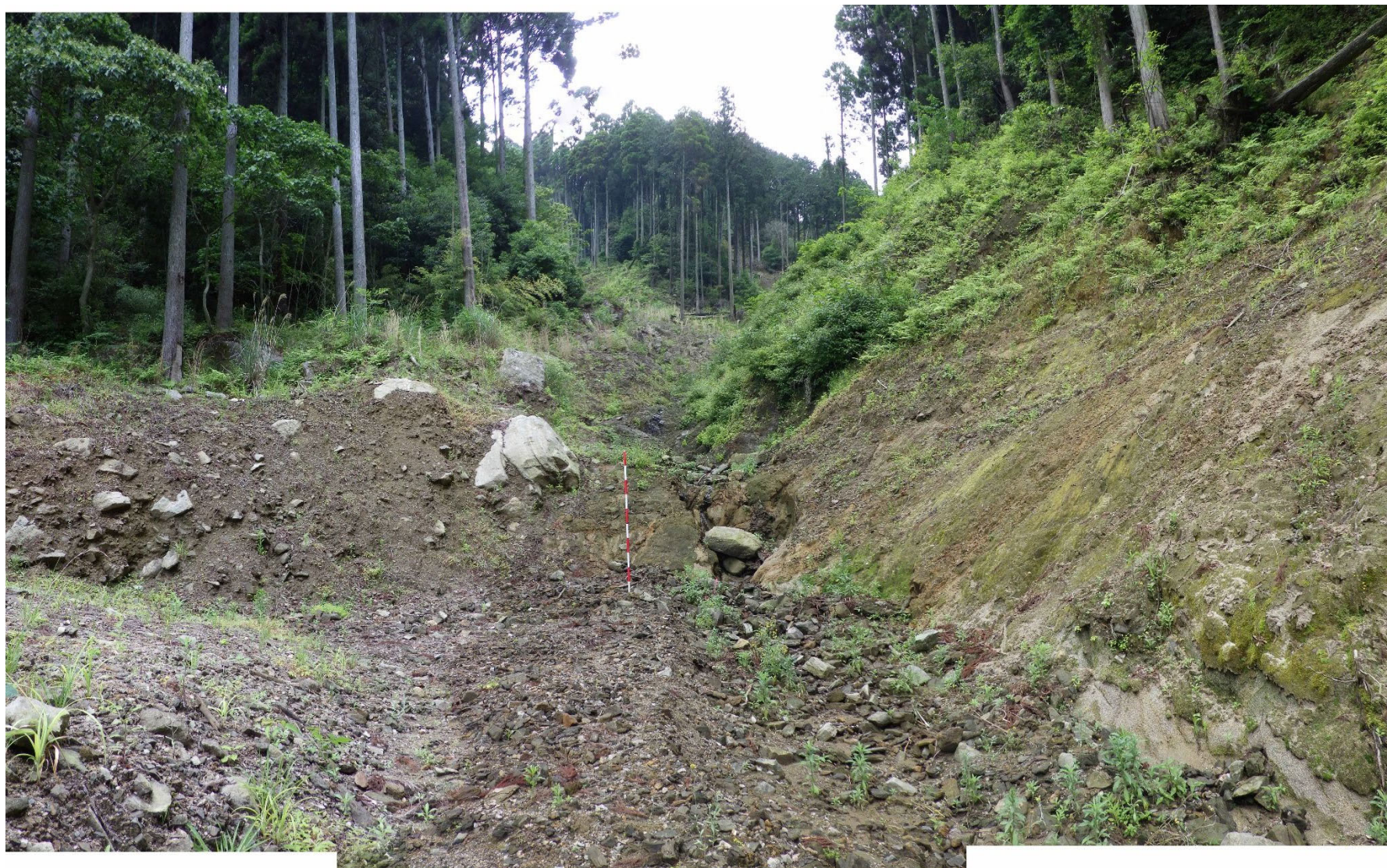
No.1 谷止工計画位置 (下流から)