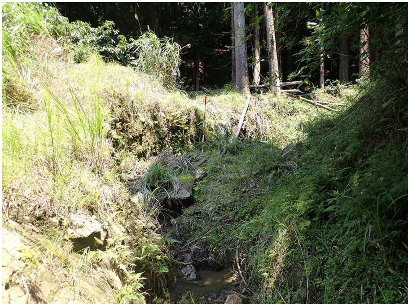
側壁水叩工計画箇所(垂直壁計画測点No.7)の状況 P7261691