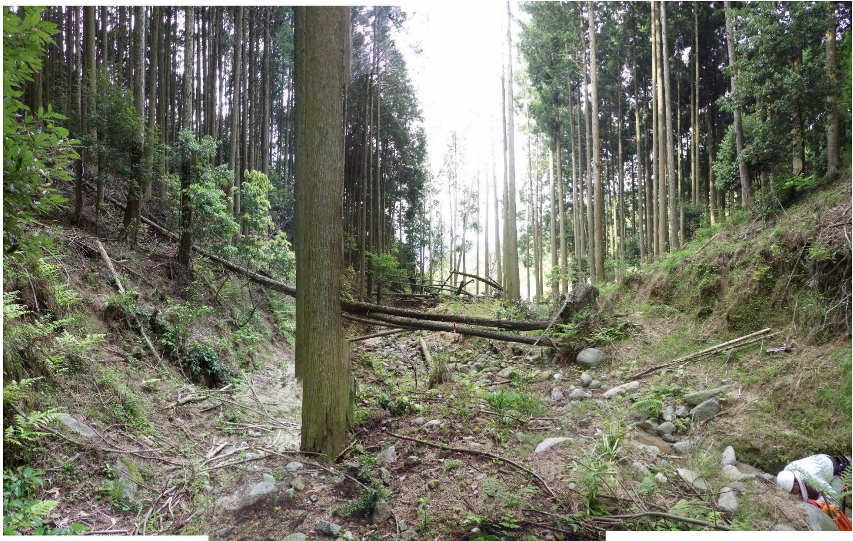
No.1 谷止工計画位置 (上流から)