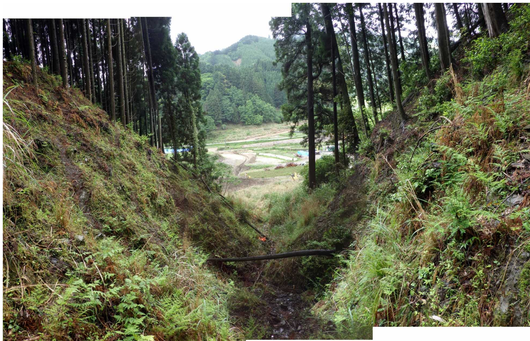
No.1 谷止工計画位置 (上流から)