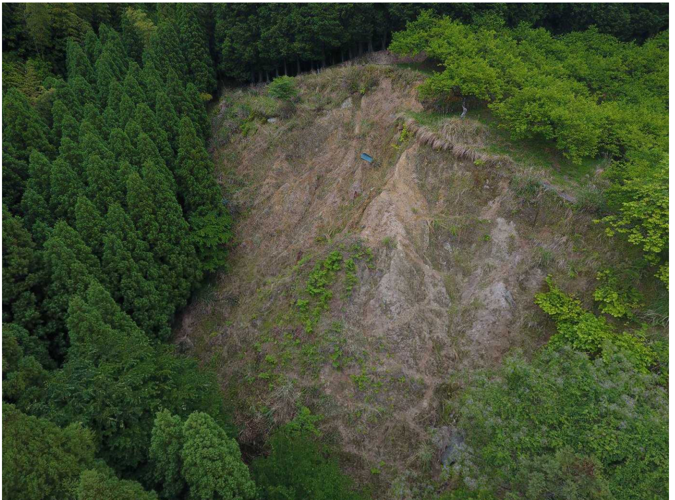
4 No.1 山腹工計画崩壊地の状況 (DJI_0285jpg)