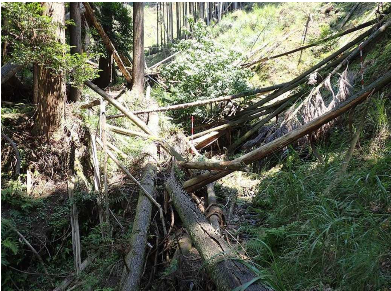
No.1谷止工計画箇所状況 P7261699