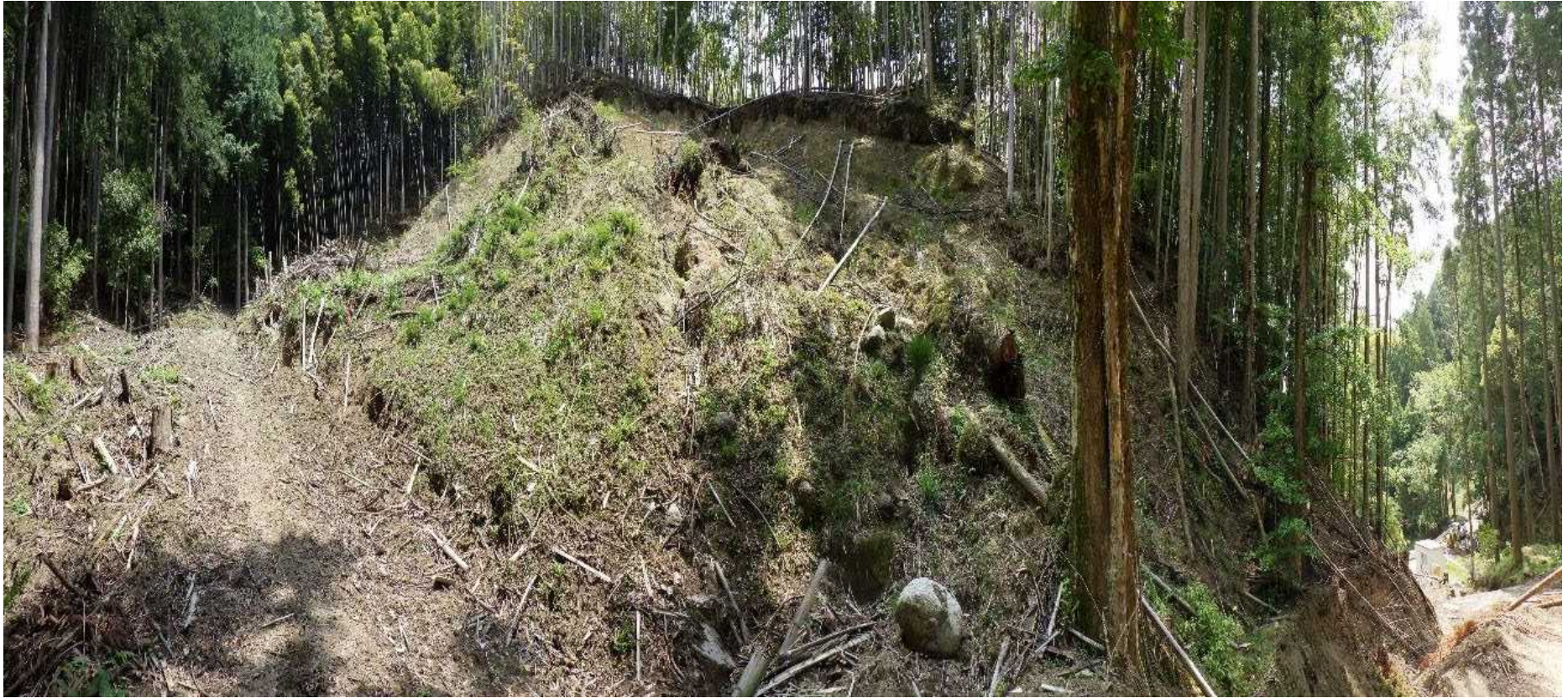
No.3 山腹工全景 (A 基線)