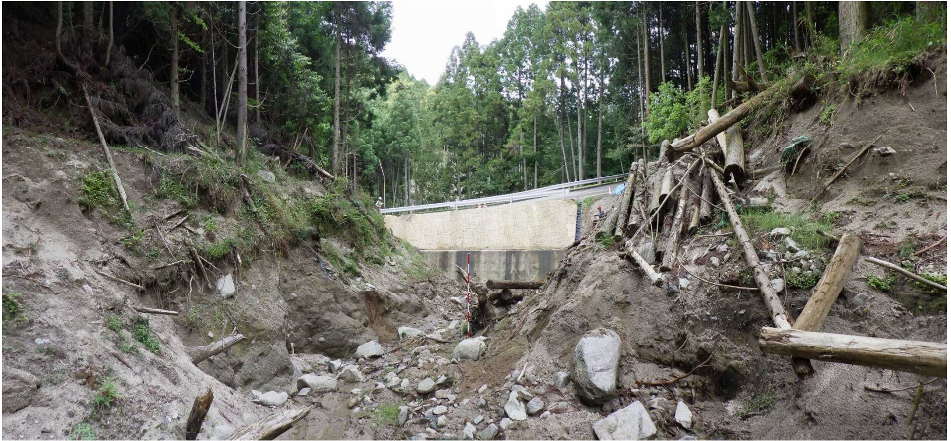
No.3 谷止工計画位置 (上流から)