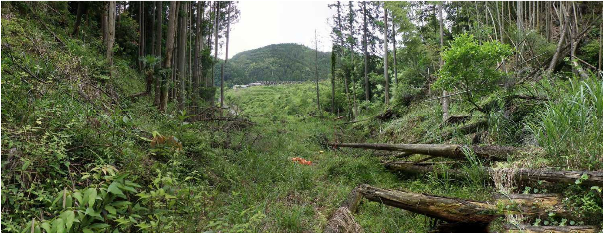
No.1 谷止工計画位置 (上流から)