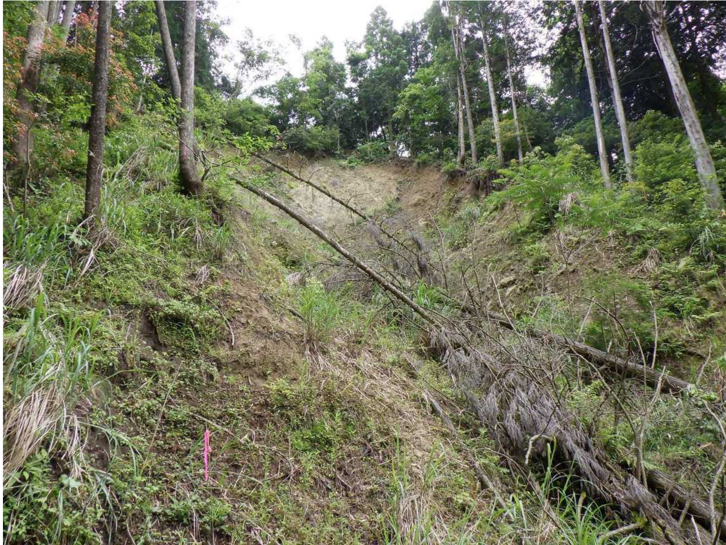
No.1 山腹工の全景（下流より）