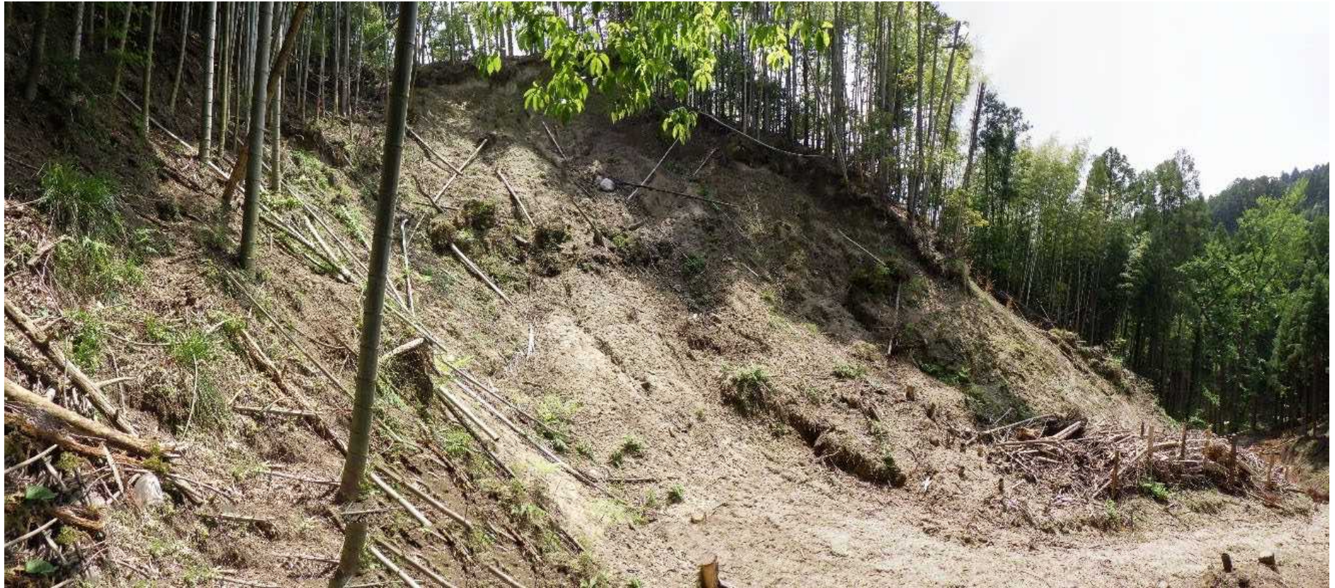
No.3 山腹工全景 (B 基線)