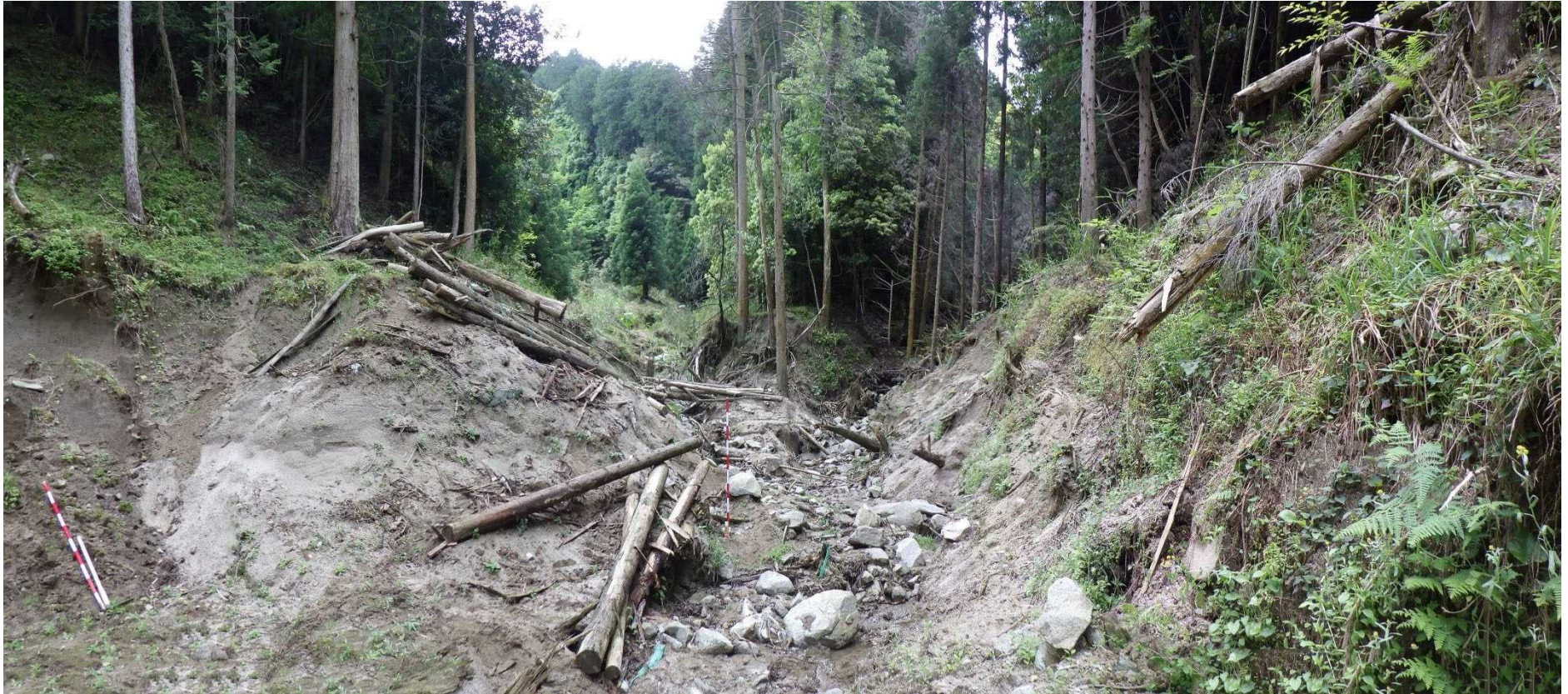
No.3 谷止工計画位置 (下流から)