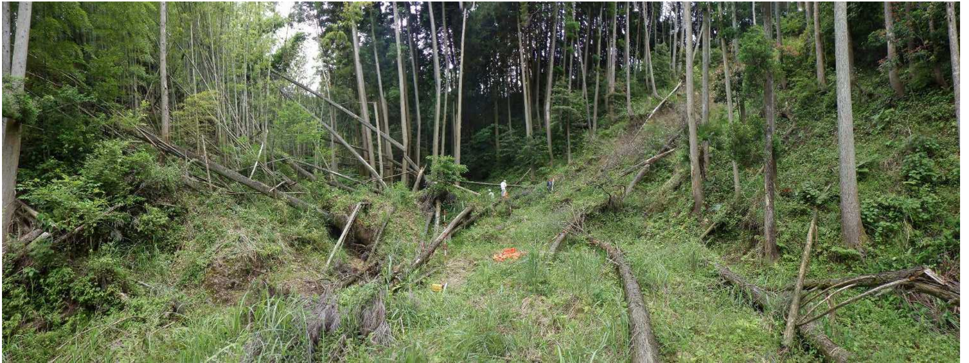
No.1 谷止工計画位置 (下流から)