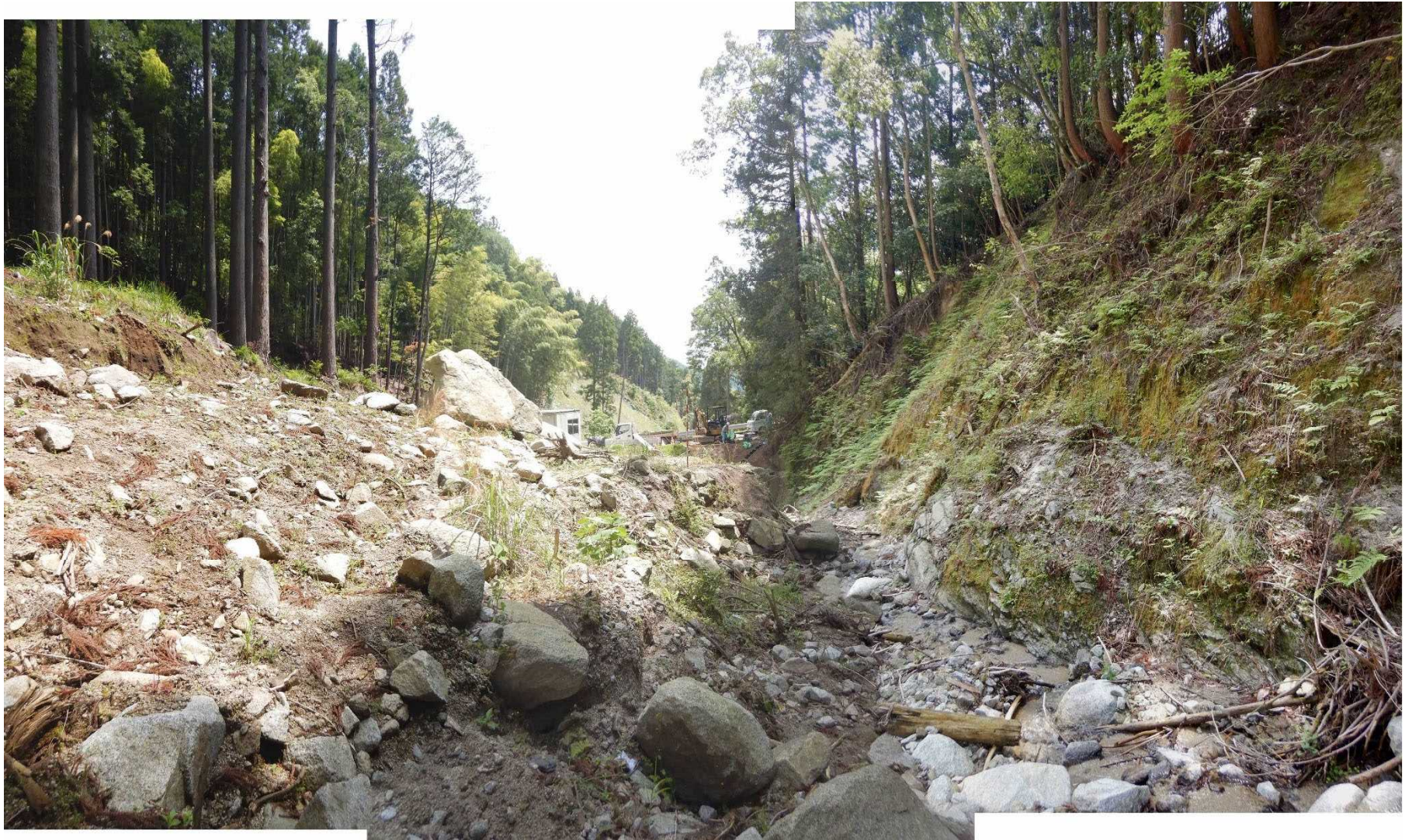
No.2 谷止工計画位置（上流から）