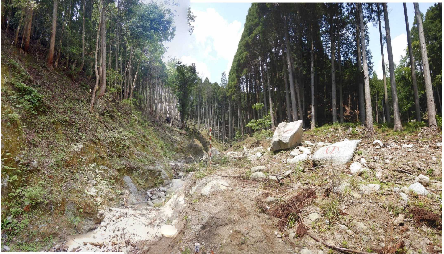
No.2 谷止工計画位置 (下流から)