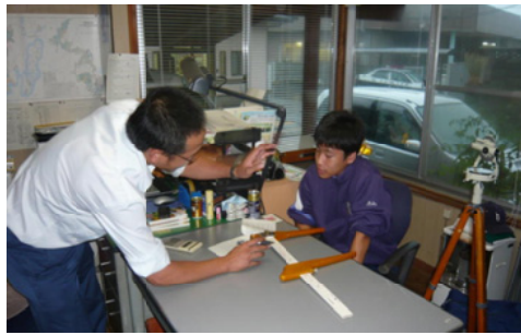
輪尺の使用方法を教わる生徒＝長崎