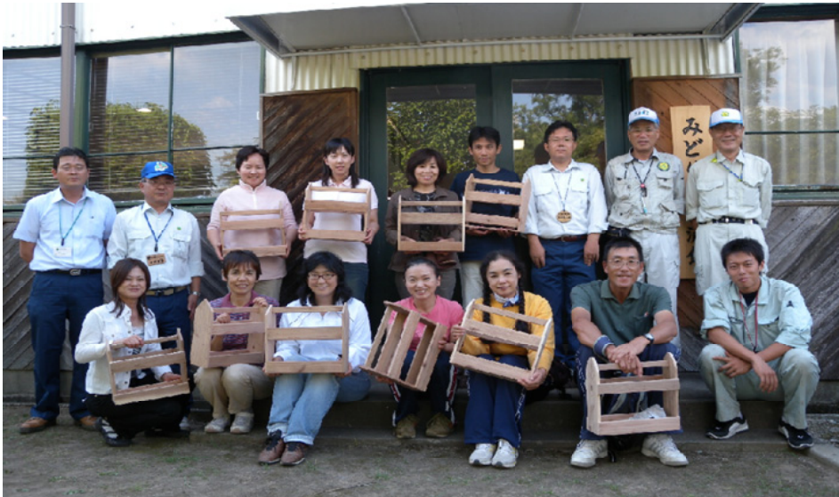
木工クラフトでマガジンラック完成

課長補佐のあいさつ の後、緑の普及係長が講師となり、学校で取り組んでいる森林環境教育や森林環境教育の課題・問題点、本日学びたいことなどを「自己紹介カード」に記入していただき、その後、局署で行っている