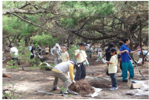
松葉かきに汗を流す参加者ら＝佐賀

【佐賀森林管理署】夢みるこども基金では、今年15回目を迎える夏のイベントを虹の松原で実施。東京や兵庫など各地から子どもや保護者、基金関係者約90人、更に応援に駆けつけた地元の方、ボランティア団体、唐津南高校の生徒など総勢140人が参加しました。午前中、当署職員が講師となり、森林管理署の仕事や虹の松原の歴史、松原の保全・再生活動が開始したことなどを説明。その後、虹の