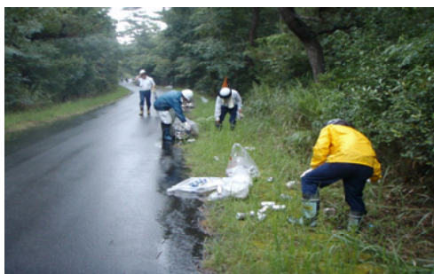
道路沿線でのゴミ回収作業＝大隅

【大隅森林管理署】鹿児島県東串良町にある海岸保安林、通称「柏原海岸林」で、清掃作業を行いました。当日は東串良町と当署から36人が参加し、森林内に散乱する一般家庭ゴミやタイヤ、家電など軽トラック5台分を回収しました。シーズンには多くのキャンパーなどで賑わう行楽地ですが、道路沿線を中心に色んな物が投棄されており、改めて人間のモラルを考えさせられる日となりました。今回、ゴミ回収の取り組みは、ゴミを捨てにくい環境づくりと、「海岸林」の改善につながり、不法投棄防止へのアピールをする良い機会となりました。