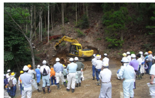
作業路作設の実演を見学する参加者＝宮崎北部

延岡市、椎原村など管内の林業関係機関、森林組合などの林業事業体や隣接する大分森林管理署の職員など約70人が参加。当該地で作業路を作設している(有)延岡物産から、作設状況などの説明を受けました。また、オペレータによる作業路作設の実演、既設の表土ブロック積工法による路体や洗越の作設箇所などを見学後、意見交換を行いました。今回、管内の各事業体からもオペレータの参加があり、表土ブロック積工法の作設状況を熱心に見学している姿が見受