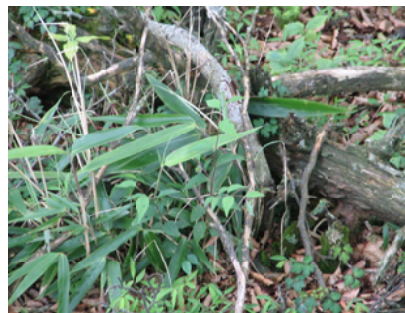
地表に顔をだしたクマササ

木々の枝につく霧水が麓から見ると白髪のように見えることから白髪岳となつてと言われています。最後に、人吉・球磨は市房山