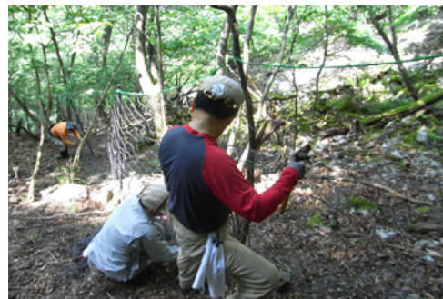
既設のネットにスカート設置＝宮崎北部