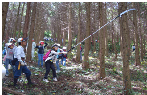
枝打ち作業に挑戦する児童ら＝熊本

【熊本森林管理署】熊本市立金峰山少年自然の家では、「よかよか金峰の森」事業として、集団宿泊教室の中で総合的な学習の一環として、自然環境学習や林業体験学習を取り入れています。今回、熊本市内の松尾東・松尾西・松尾北・小島・中島小学校の5年生99人を対象に、当署も講師を派遣し森林教室を実施。児童らは午前中、保育間伐の作業に挑戦しました。保護員を着用しての慣れない作業に「疲れた」。また、間伐後の林内に日差しが入り込む様子に「明るくなった」などの声が聞かれました。午後は、本立て、丸太切り、ペン立て作りを体験し、木工品の暖かみや森林の大