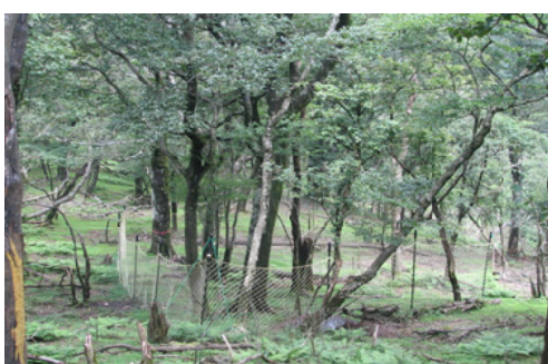
食害防止・樹木の保護のためシカネット設置

ササに覆われていたため周囲を見渡せないくらいであったのが今は360度見晴らしの良い所になっていて、天気の良い日は、南に市房山、西には霧島連山などが一望でき眺めも最高に良いところになっています。一年を通して登山愛好者が訪れる白髪岳ですので、今後ますますすばらしい自然を後世に残すため、植生の保護などに精一杯取り組みたいと考えています。