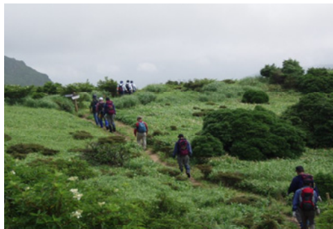
登山者に高山植物の保護等呼びかけ＝大分西部

講師に、国有林の役割や仕事、ツシヤママネコ生態調査などについて学んだり、コンパス測量、保育間伐などを体験しました。生徒からは「体験で学んだことを忘れず、これからも勉強や部活のキャプテンとして頑張ります」とのお礼の手紙をいただきました。