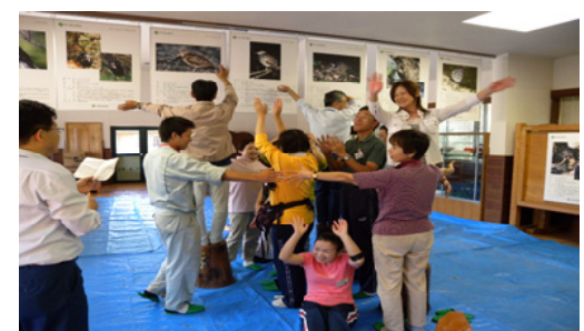
身体を使って一本の木に挑戦する参加者

次は企画係長が講師となり、木工クラフトを行いました。日ごろ手にしているチョークを鋸や金槌に持ち替え、慣れない手つきで挑戦。悪戦苦闘しながらも個性的なマガジンラックが完成。出来上がった作品を手に皆さんは満足げな表情で写真に収まっていました。