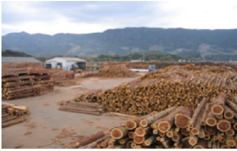
安定供給される国有林材＝伊万里木材市場

スギについては、182千立方材の販売を計画しており、間断のない生産に努めることで大型工場や地域製材工場への質の高い安定供給を図ります。ヒノキについても、36千立方材のシステム販売に取り組むことで、販売しにくかったB材を合板や集成材の原材料として需要拡大