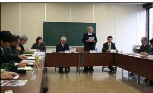
議題について説明する関係者＝綾町役場