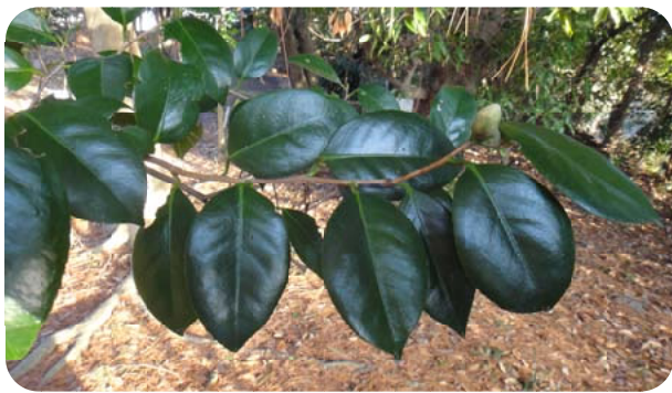
の東の奥にあります。

ツバキは本州から九州の海岸近くに生え、監物台樹木園の野生のツバキは、入り口からすぐ