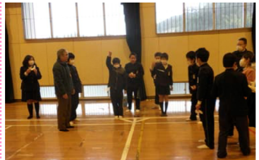
種飛ばしに挑戦する児童ら＝佐賀

よって運ばれるもの③海流で運ばれるものなど、いろんな種について学びました。次に、子孫を残すため風で運ばれる翼を持った種がどのように飛散するかを実験しました。グライダーのように滑空する種、回転しながら落ちる種など、児童たちは、楽しそうに種を飛ばして確認していました。先生からは、「勉強になり、こんな森林教室もいいですね」などの感想が聞かれました。