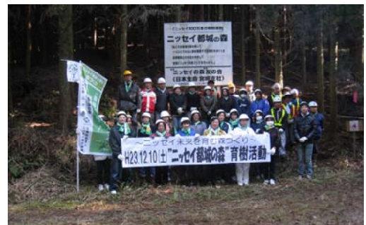
作業終了現地で記念撮影＝都城支署

また、同日に綾町・高年者研修センターにおいて、多くの地域住民などの参加のもと、綾プロ関係機関5者により事業説明