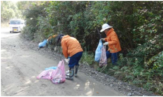
不法投棄ゴミを回収する参加者＝大隅

【大隅森林管理署】国有林野クリーン活動の一環として、鹿児島県大崎町にある海岸保安林「くいの松原」において、清掃作業を行いました。当日は大崎町役場、大隅素材生産事業協同組合、大隅森林管理署OB、巡視員など45人が参加。松林内に散乱する空き缶やペットボトルなどの一般家庭ゴミやタイヤなど軽トラック6台分を回収しました。「くいの松原」は保安林の役割を果たすとともに、地域の憩いの場として利用者の多い景勝地ですが、道路沿を中心に不法投棄があり、改めて人間のモラルについて考えさせられました。