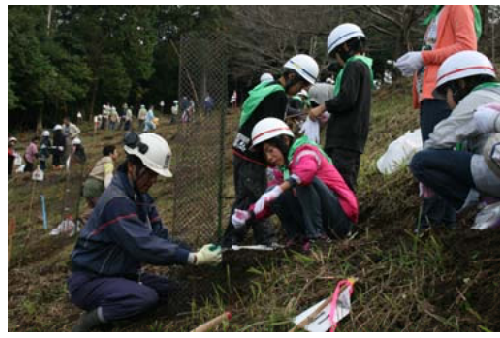
広葉樹の植樹を行う参加者＝熊本南部

【熊本南部森林管理署】多良木町奥野の「妙見野自然の森林展望公園」において、多良木町久米財産区および人吉・球磨地