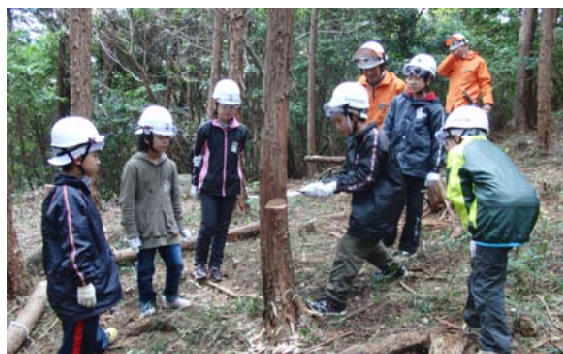
ノコギリを使用し間伐体験をする児童ら川熊本

平山国有林で熊本市立若葉小学校の児童90人を対象に森林教室を行いました。肌寒い天候の中、児童らは、保育間伐と枝打作業を体験。枝打作業では、枝が落ちる度に歓声が上がります。間伐作業では、恐る恐るノコギリを使用し、木が倒れる瞬間は、感動と達成感で目が輝いていました。児童たちにとって初めての経験でしたが、全員が積極的に取り組み、森林を育てる大切さ、大変さを体験できた有意義な一日となりました。