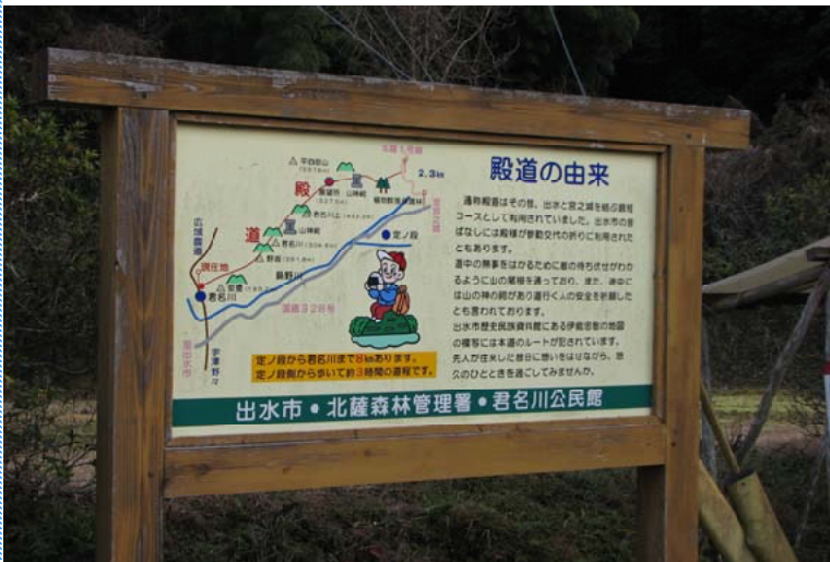
(上) 出水市とさつま町を結んでいる「古道」の状況 (下) 広域林道北薩1号線の途中に設置された「殿道由来」の看板