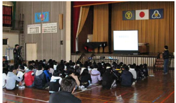
森林ふれあい係長の説明に聞き入る児童ら＝宮崎

【宮崎森林管理署】2月3日、憶振興会との共催で宮崎市立潮見小学校6年生児童101人を対象に森林環境教育「お届け講座」を行いました。当署森林ふれあい係長が、森林の持つ働き・