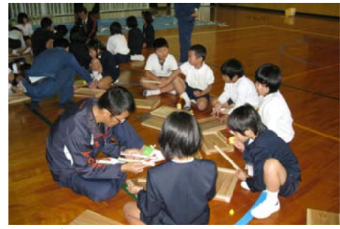
本棚作りに取り組む児童ら＝屋久島

【屋久島森林管理署】屋久島町立小瀬田小学校で、全校児童41人を対象に森林教室を実施。紙芝居「森林からの贈り物」で森林の役割について学びました。午後からは、二つのグループに分かれ、木のパズル作り（低学年）と、本棚作り（高学年）に取り組みました。初めて手にする工具に手こずっていましたが、児童らは無事に作品を完成。楽しい森林教室となりました。