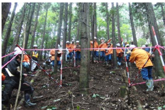
現地で開設ポイントについて検討する参加者＝大隅

【大隅森林管理署】曾於市財部町に位置する伊良ヶ谷国有林内において、鹿児島県や森林組合、林業事業者など70人が参加し、森林作業道現地検討会を行いました。当署職員を講師に、公民館で森林作業道の路線の設定についての講義を行いました。午後からは、保育間伐請負実行中の現場でヘアピンカーブ昨設の手順について、具体的な開設ポイントを設定した説明を行い、参加者から高い評価を得たところです。今後は各事業者が各現場で技術向上に取り組むことを確認し検討会を終了しました。