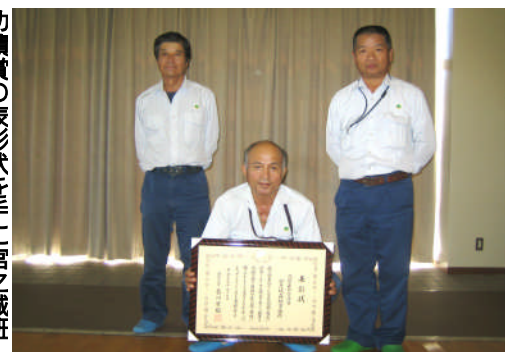
功績賞の表彰状を手に宮之城班のみなさん北薩

【北薩森林管理署】当署の宮之城森林事務所は、現場におけるシカ被害対策としての頭数調整に取り組み、くくり罠の改良と普及に努め、罠の設置場所や設置方法などの技術を活かしシカ捕獲の実績を上げています。このため管内全体のシカ被害対策への貢献が認められこのほど林野庁長官から功績賞を授与されました。