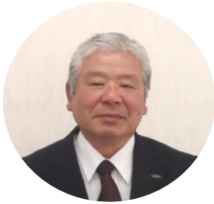
宮崎中央森林組合

森林組合は、地域の森林管理主体として、地域の森林を共同の力で育て守り続け、森林環境保全と林業発展を通じて、地球温暖化防止へ貢献するとともに、国土・水源の保全、健全な森林環境と良質の木材を提供しながら、健康で安心豊かな住生活を支えていくことを使命としている。