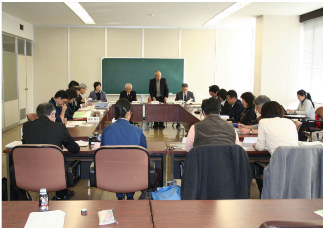
第17回綾プロ連携会議へ参加された関係機関のみなさん＝宮崎県綾町役場