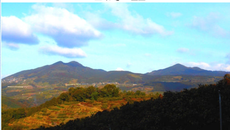
金峰山（一岳）と並ぶ二ノ岳・三ノ岳の全景

『金峰山』という名は全国に6個所あるそうで、奈良県吉野町の金峯山を源流とする山岳信仰のシンボルでもあり、修験道仰の道場としてきた歴史の側面も有している一方、ハイキングスポットとしても人気が高く、車での登頂も可能なほか、ベテラ