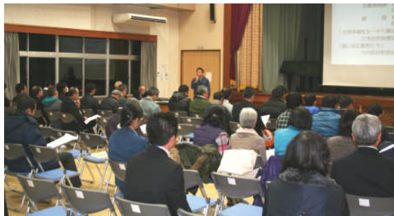
事業説明会へ参加した地域住民＝宮崎県綾町

1月15日宮崎県綾町役場会議室において、綾川流域照葉樹林帯保護・復元計画（綾の照葉樹林プロジェクト）第17回連携会議が、関係機関5者（九州森林管理局、宮崎県、綾町、日本自然保護協会、てるはの森の会）の出席の下、開かれました。会議は、平成24年度事業取組状況、綾川流域照葉樹林帯保護・復元計画推進協定の再締結（案）、短期行動計画（第Ⅲ期）平成25