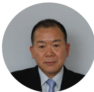
ひろゆき 博行 こが 古閑