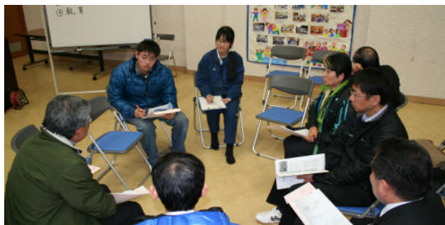
新たな試みのワークショップの様＝宮崎県綾町

（29年度）の見直し案が主な議題で、協定書は再締結に向けて調整することとし事業取組状況及び第Ⅲ期行動計画案は提案とおりました承されました。また、同日に綾町・高年者研修センターにおいて、地域住民約60人が参加し、綾プロ関係機関5者による「生物多様性とプロジェクトの取組」と題して事業説明会を開くとともに、新たな試みとして参加者による「環境、教育、観光、町づくり」ワークショップを実施し、今後の綾プロ及び事業説明会に活かす取組が行われました。（担当Ⅱ計画課）