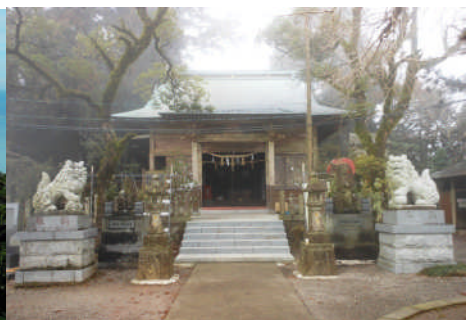
頂上付近に建つ「金峰山神社」

覚で子どもと一緒に会話しながら登山出来る「三ノ岳」（別名「那智岳」、標高六八一㍎）、さらにはこの三つを制覇する「縦走ルート」と、お手軽なハイキングから本格的な登山まで幅広く満喫できます。また、麓にある「金峰森の駅みちくさ館」では、メジャーな登山ルートからマニアックな登