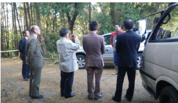
現地にて説明を聞く町議会経済建設委員の一行「都城支署」

【都城支署】屋久島町から今後の森林施業取組のための業務調査として依頼を受け、屋久島町議会経済建設委員7人が当署管内の列状間伐施設を視察しました。委員からは列状間伐施設に至った経緯、メリット・デメリット、定性間伐との経費比較、屋久島で実施する場合の注意点などについて質問がありました。視察後、これからの屋久島町の林業振興の参考となる初期の目的を達成する事ができまじと代表からお礼の言葉がありました。