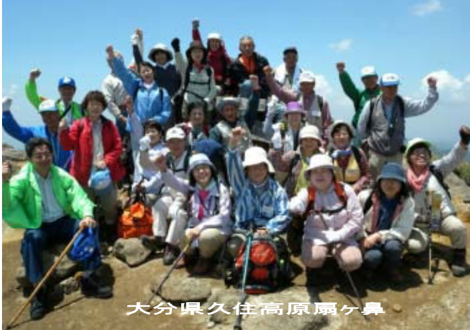
大分県久住高原扇ヶ鼻