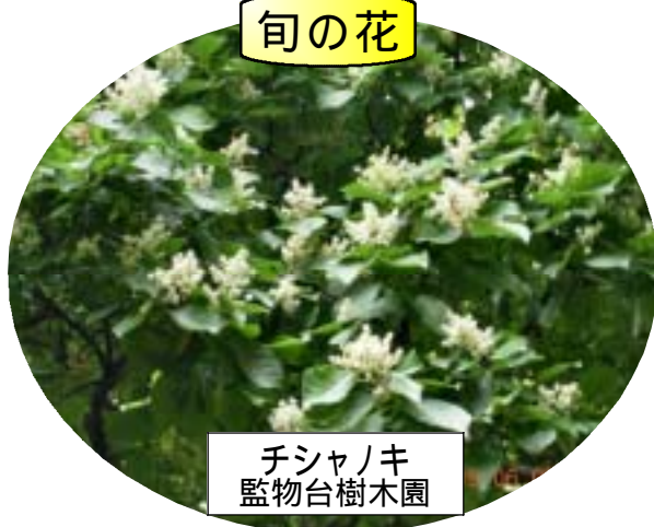
チシャノキ 監物台樹木園