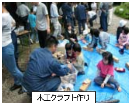
木工クラフト作り

実施。また、昼食時には、同会議からイノシシ汁が振る舞われ、参加者は思い思いの場所で手作りの弁当に舌鼓。普段、谷川のせせらぎや鳥の声しか聞こえない山間に、子ども達の賑やかな声が響きわたりました。