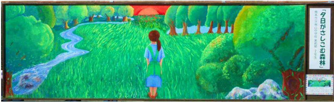
作品名：「夕日がさしこむ森林」 制作者：熊本市立 帯山中学校 美術部 2年生