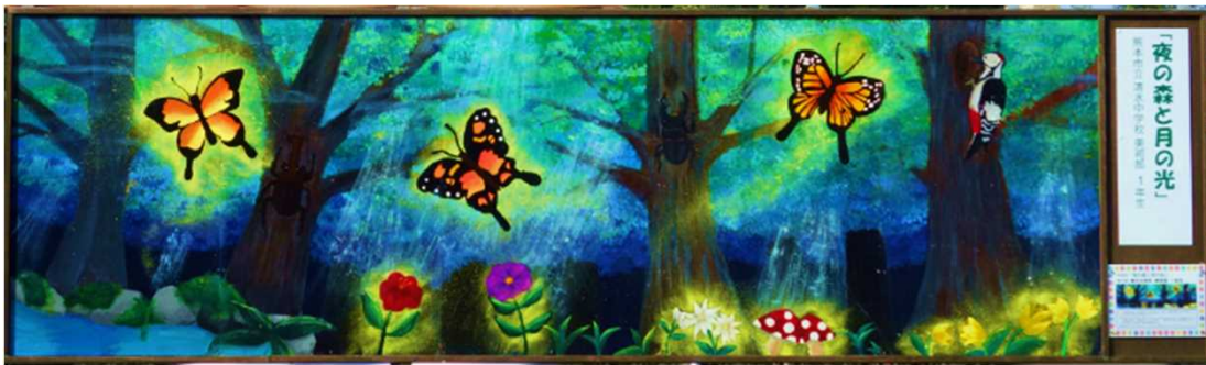
作品名：「夜の森と月の光」 制作者：熊本市立 清水中学校 美術部 1年生