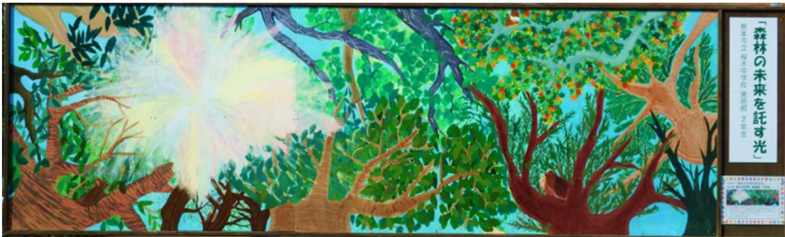
作品名：「森林の未来を託す光」 制作者：熊本市立 桜木中学校 美術部 2年生