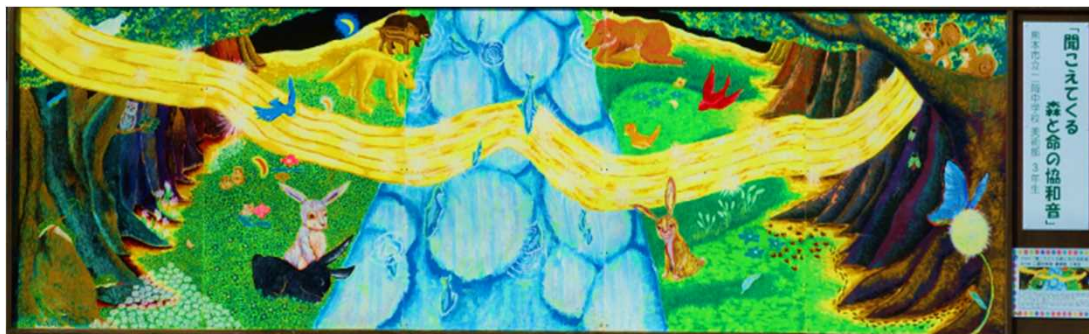
作品名：「聞こえてくる森と命の協和音」 制作者：熊本市立 二岡中学校 美術部 3年生