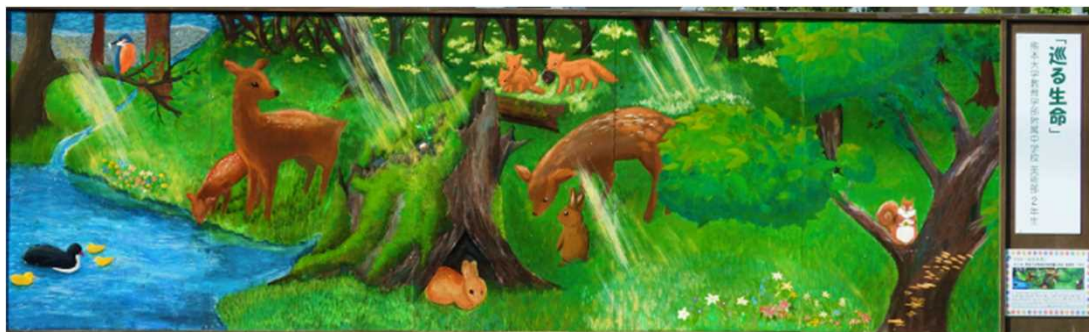
作品名：「巡る生命」 制作者：熊本大学教育学部 附属中学校 美術部 2年生