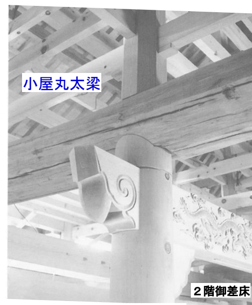
■2階御差床と小屋丸太梁