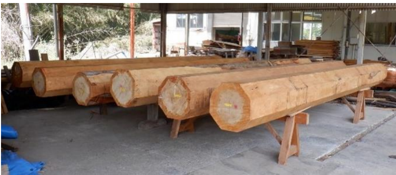
イヌマキの粗挽き製材後の保管状況