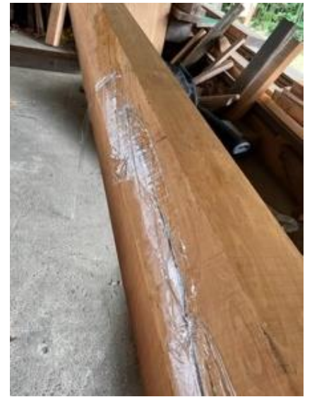
乾燥進捗により繊維に沿って斜めに細かなヒビは見られるが背割りは実施しない予定