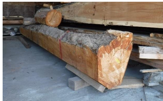
イヌマキの樹皮付きの保管状況