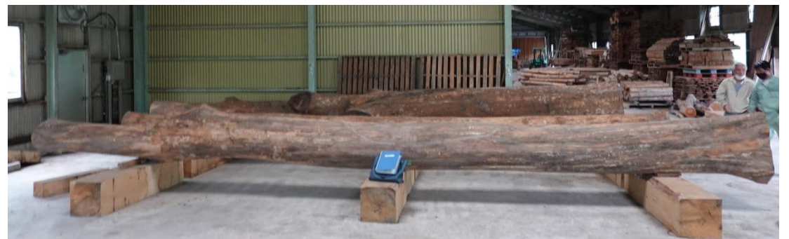
倉庫での保管状況