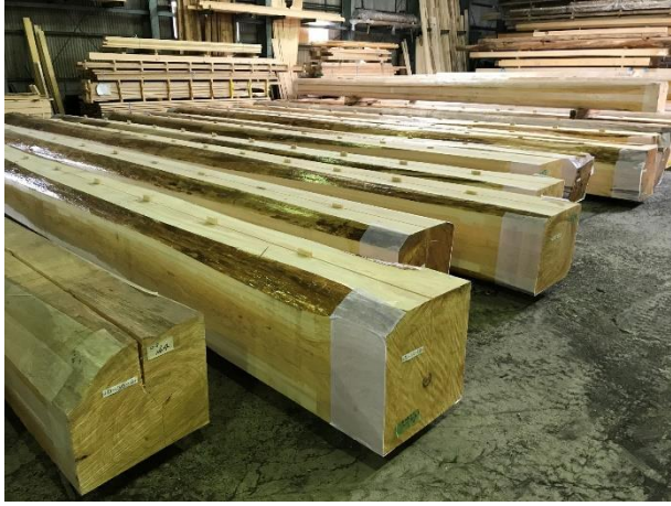
倉庫での保管状況