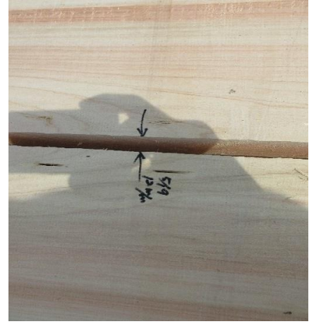
背割り管理の状況