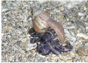
ムラサキオカヤドカリ *