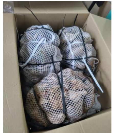
違法捕獲されたオカヤドカリたち