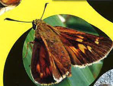
アサヒナキマダラセセリ