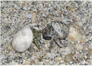
ナキオカヤドカリ *