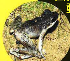
コガタハナサキガエル