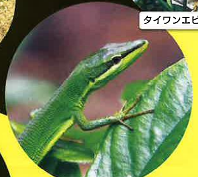
サキシマカナヘビ