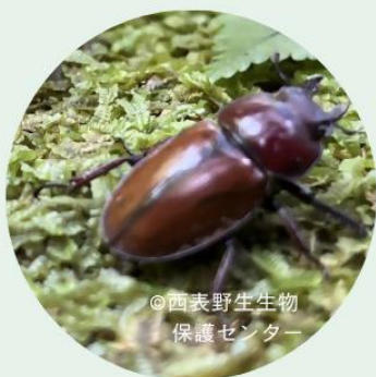
●チャイロ マルバネクワガタ