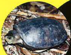
ヤエヤマイシガメ