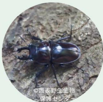
●ヤエヤマ マルバネクワガタ