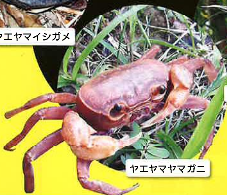
ヤエヤマヤマガニ