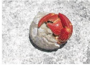
サキシマオカヤドカリ **