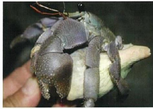
コムラサキオカヤドカリ **