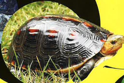
ヤエヤマセマルハコガメ