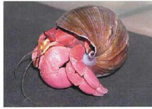
オオナキオカヤドカリ *