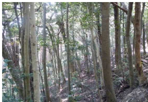
福連木 カシ、シイ林 (福連木国有林321林班)