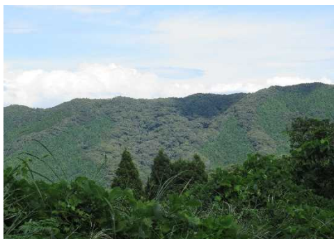
福連木 希少個体群保護林 全景 (福連木国有林321林班)

天草市は熊本県の西部に位置する天草諸島の上・下島に位置しています。総面積(68,387ha)の68%(46,202ha)が森林で、国有林野はそのうちの2%(888ha)です。その93%が水源涵養タイプ、3%を自然維持タイプ、に区分し管理経営を行っています また、福連木の国有林は「福連木官山」として親しまれ、「福連木希少個体群保護林」に設定、保護しています。