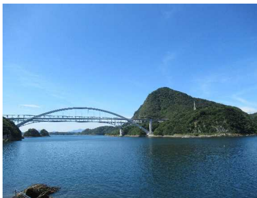
三角から見た天草1号橋と飛岳国有林 (飛岳国有林319林班)

上天草市は熊本県の西部に位置する天草諸島の上島に位置しています。総面積(12,694ha)の60%(7,609ha)が森林です。そのうちの国有林野は3.0%(249ha)です。その62%が山地災害防止タイプの土砂流出崩壊防備エリア、38%を水源涵養タイプに区分し管理経営を行っています。