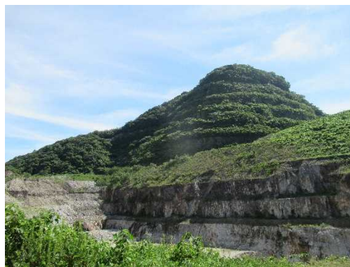
飛岳碎石場 (飛岳国有林319林班)