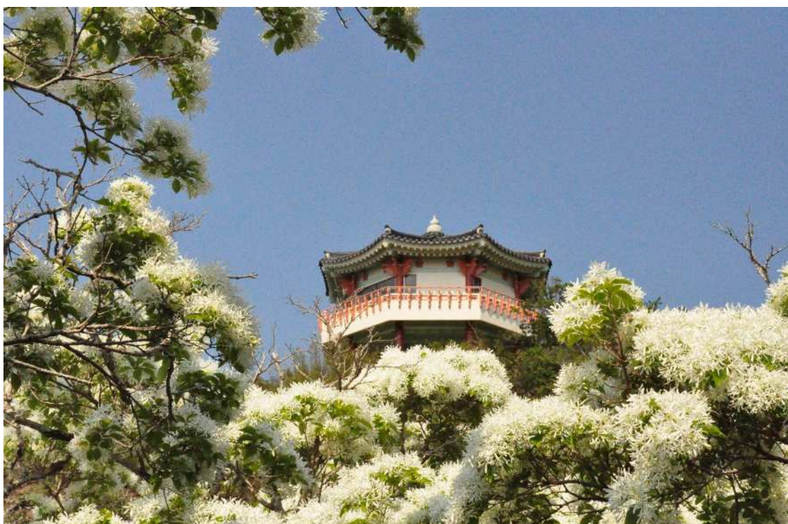
「韓国展望台とヒトツバタゴ」