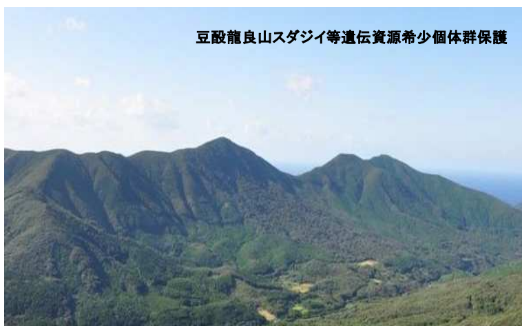
豆敷龍良山スダジイ等遺伝資源希少個体群保護

龍良山原始林はスダジイ、アカガシ、イスノキなどが生育し国の天然記念物として指定されています。 そのため遺伝資源保存のための保護林として管理しています。