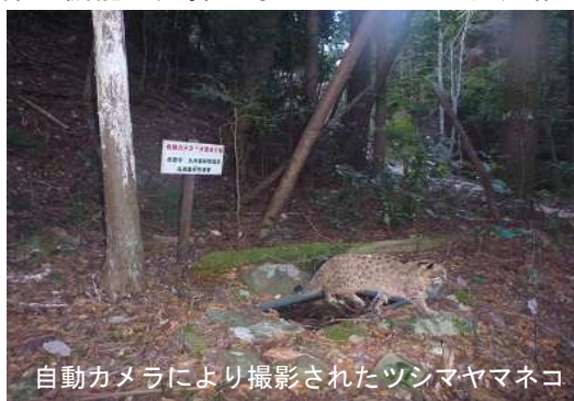
自動カメラにより撮影されたツシマヤマネコ

ツシマヤマネコが生息する御岳周辺の人工林では保育間伐等による生息環境の維持・整備を行っています。