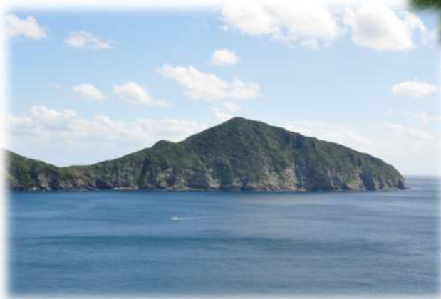
豆敷内院龍良山神崎スダジイ等希少個体群保護林