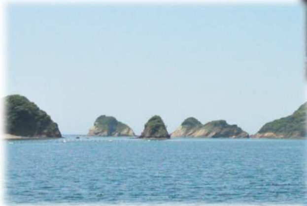
小網349林班（魚つき保安林）の通称ゴリラ岩