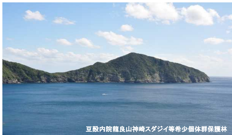
豆敷内院龍良山神崎スダジイ等希少個体群保護林

神崎半島のスダジイやイスノキ、ナタオレノキ等からなる群生で沿岸部の暖地性照葉樹林として自然性・希少性が高いことから保護林として管理しています。