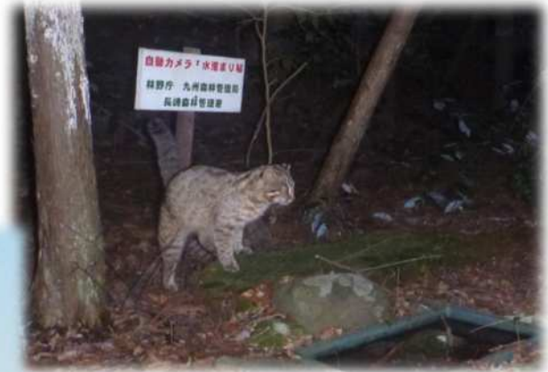
自動撮影カメラで撮影されたツシマヤマネコ