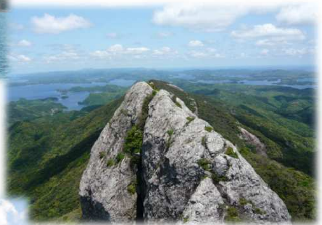
白嶽山頂からの浅芽湾