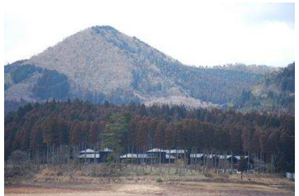
国土保全機能の発揮