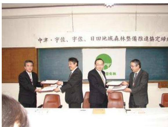
森林整備推進協定