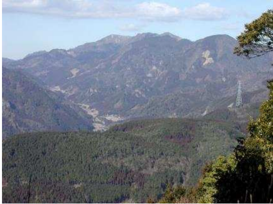
自然環境の維持保全を重視