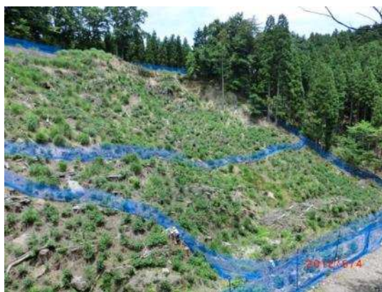
侵入防護柵の設置