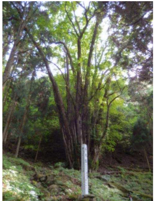
千本桂(大分県指定天然記念物)