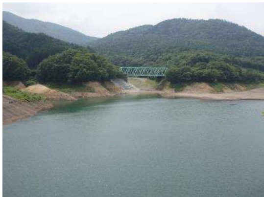
水資源を育む森林