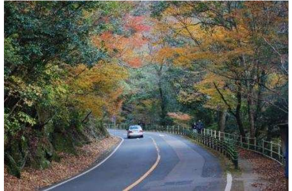
森林とふれあいの場を提供