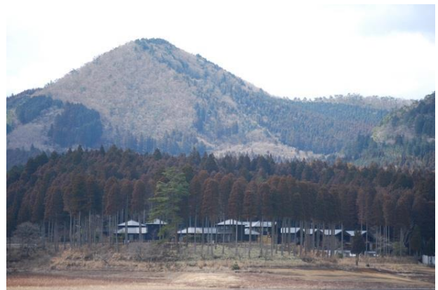
国土保全機能の発揮