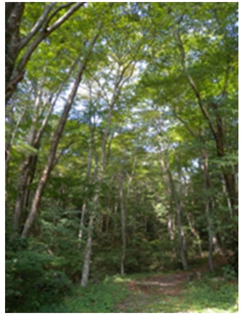
森林とのふれあいの場の提供