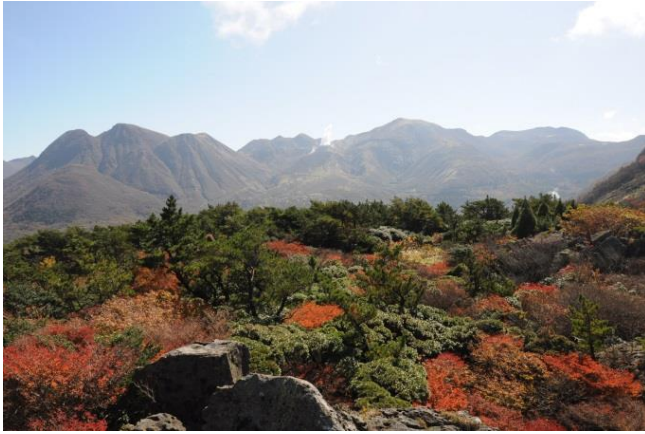
自然環境の維持保全