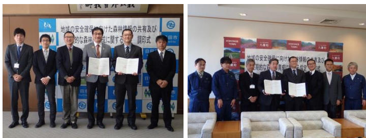
地域の安全確保に向けた森林情報の共有及び長期的な森林の育成に関する協定の締結