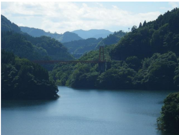
水資源を育む森林の整備