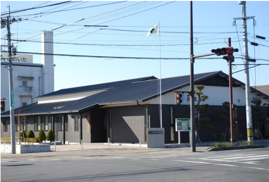
大分西部森林管理署庁舎(平成24年10月落成)

構造材、内装材には、国有林間伐材をはじめ県産材をふんだんに使用(構造・造作材114m 3 、内装材18m 3 )し、天領日田の街並みに合わせて切妻風屋根の落ち着いた町屋風の木造平屋建てとしています。