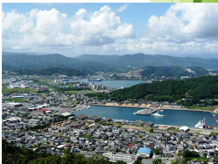
物流の拠点細島港