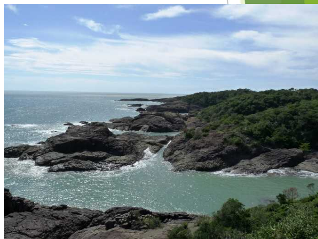
日豊海岸国定公園