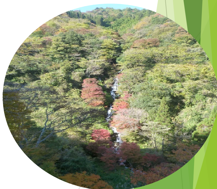
宮崎北部森林管理署