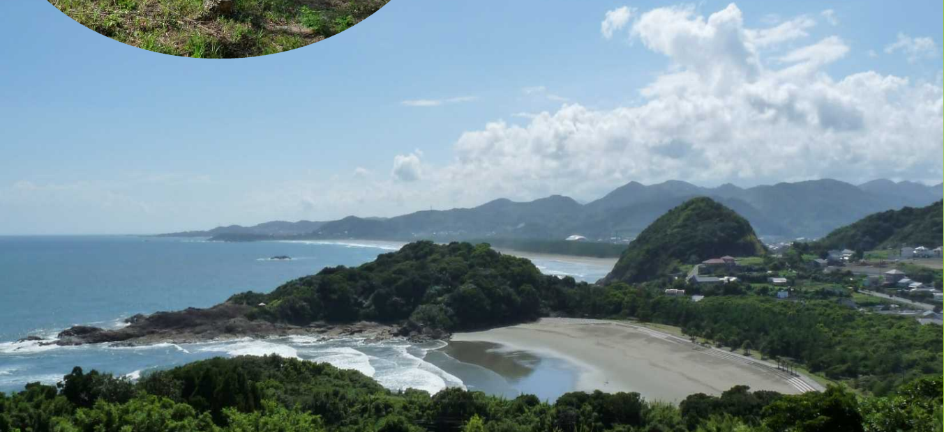
伊勢ヶ浜・お倉ヶ浜海岸