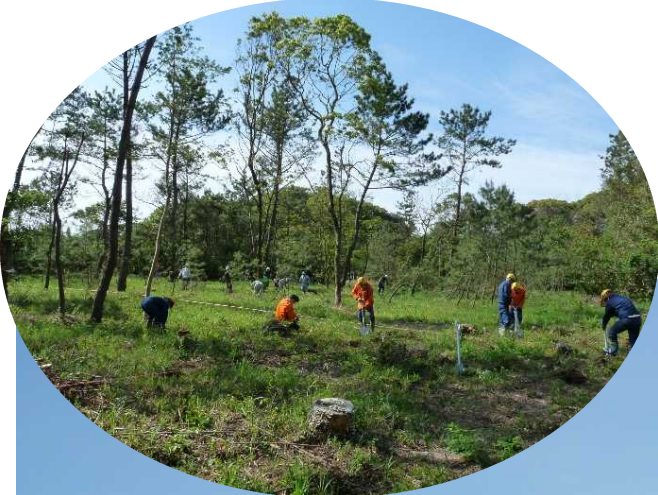
伊勢ヶ浜 ボランティア植樹