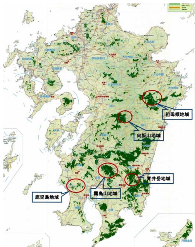
図 1-2-1 事業対象地域位置

森林管理署・西都児湯森林管理署・宮崎森林管理署・宮崎森林管理署都城支署・北薩森林管理署・鹿児島森林管理署）。