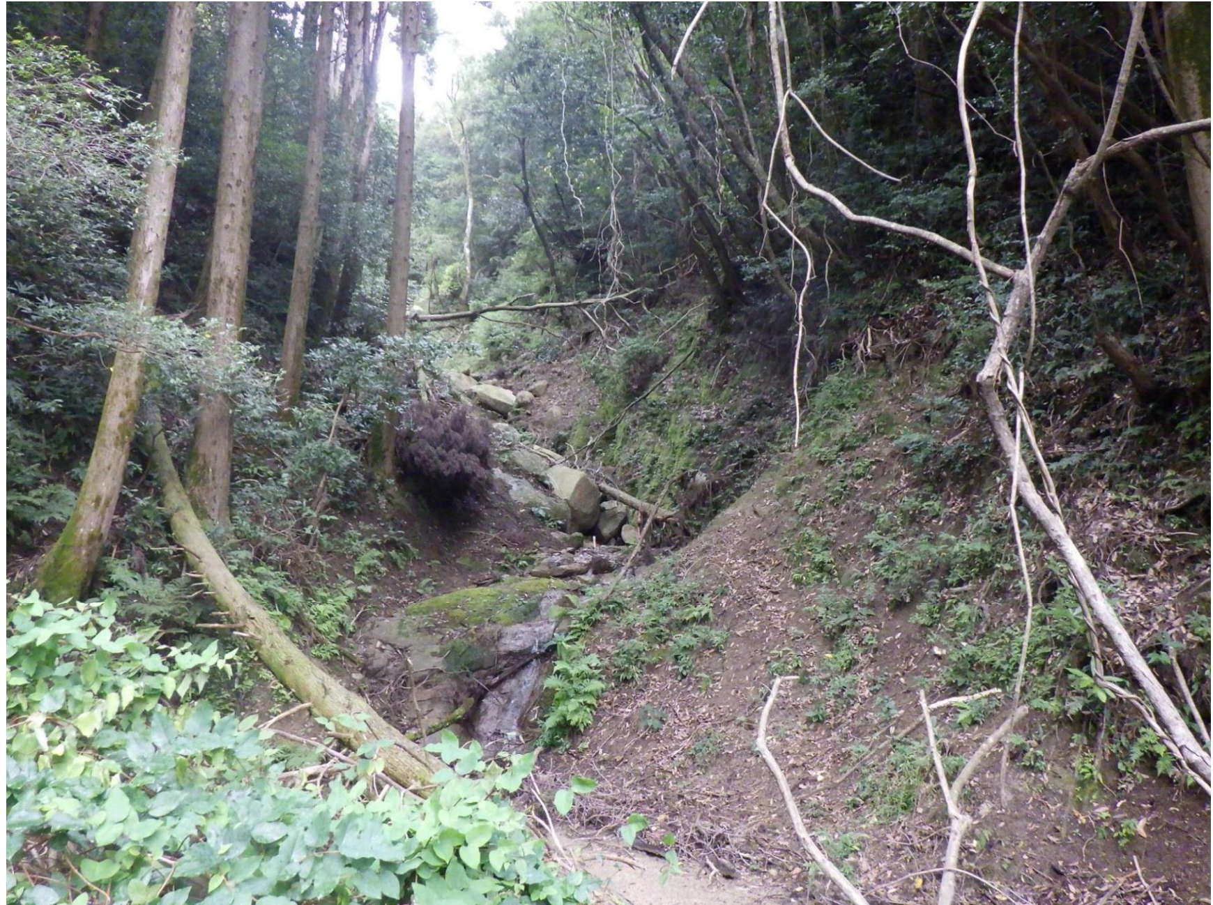
№. 1 谷止工計画地の状況