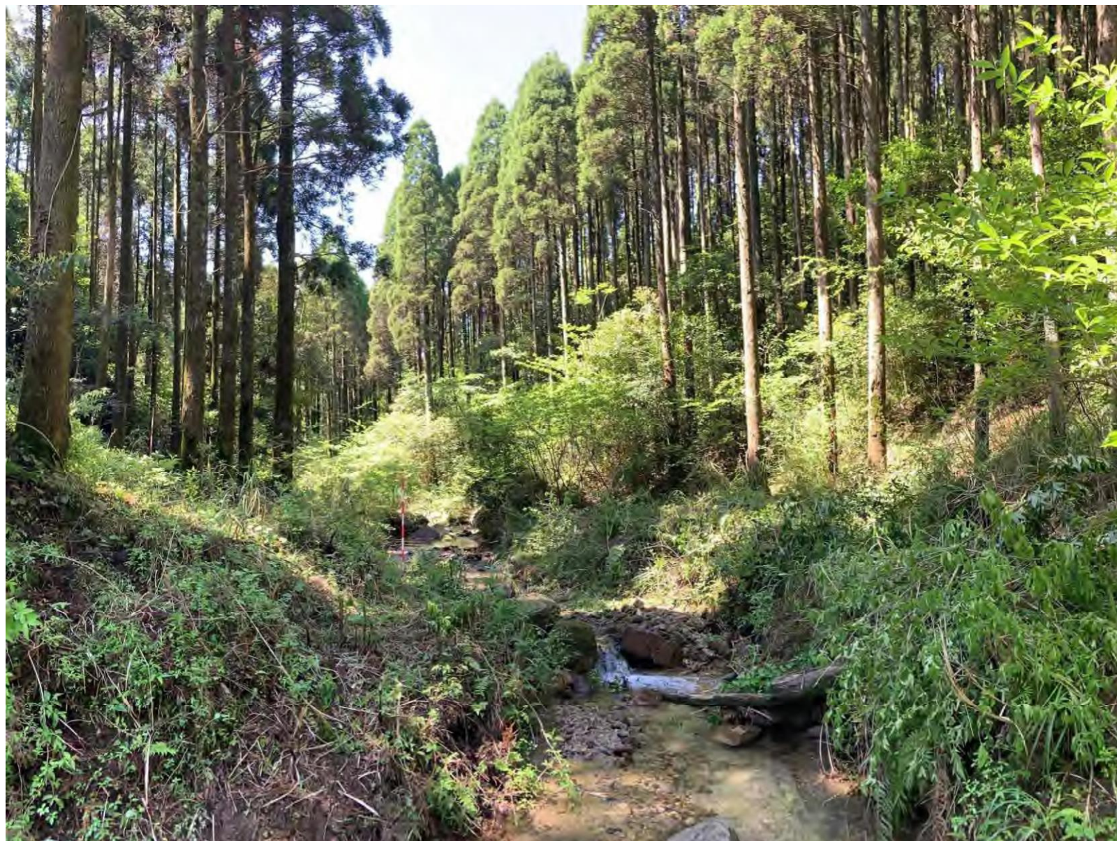
測点No. 25のNo. 1谷止工計画地の状況