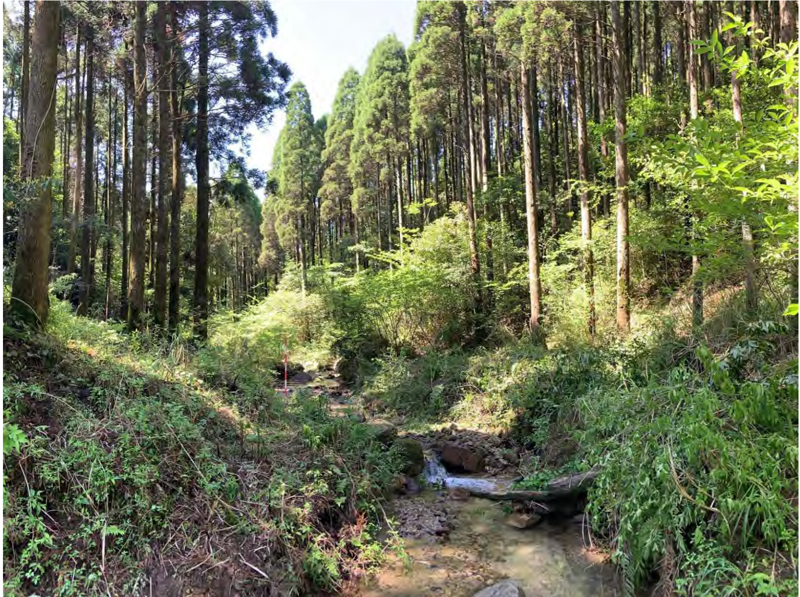
測点No. 25のNo. 1谷止工計画地の状況