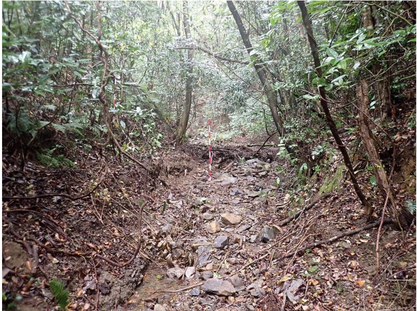
No. 1 谷止工計画箇所 の 状況 PB182409