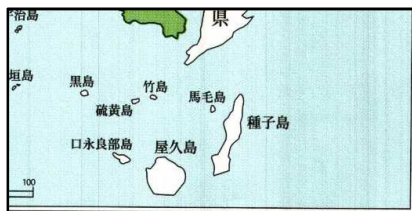
万分の1地形図索引