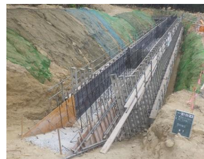
スライド式型枠の採用（品質管理）