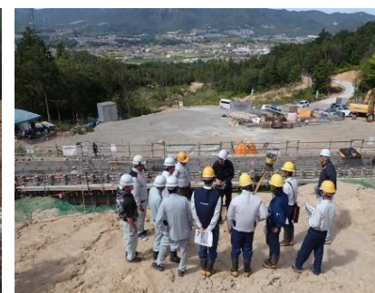
レーザースキャナー 見学会