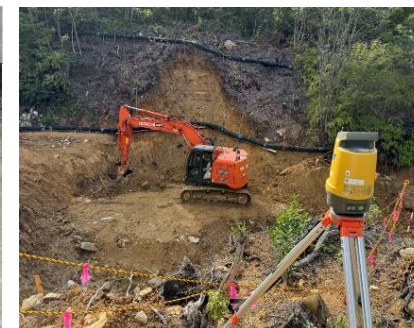
ICT施工状況 (マシンガイダンス)