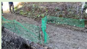
ノウサギのN型捕獲罠