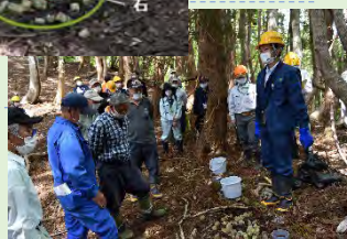
小林式誘引捕獲法