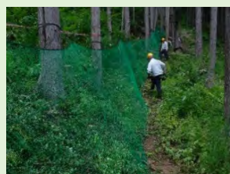
低コストシカ柵 (低価格ネットと立木利用)