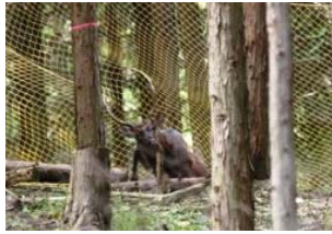
「ネットに絡まったオスジカ」