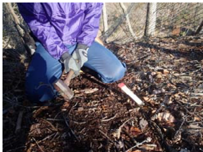
「アンカー斜め打ち」

等の措置を行うことが必要であり、外にも色々なメンテナンス方法があると思いますので、色々な方法を考えて試して見て下さい。