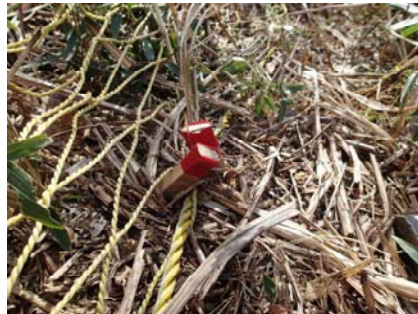
「アンカー X 状打ち」