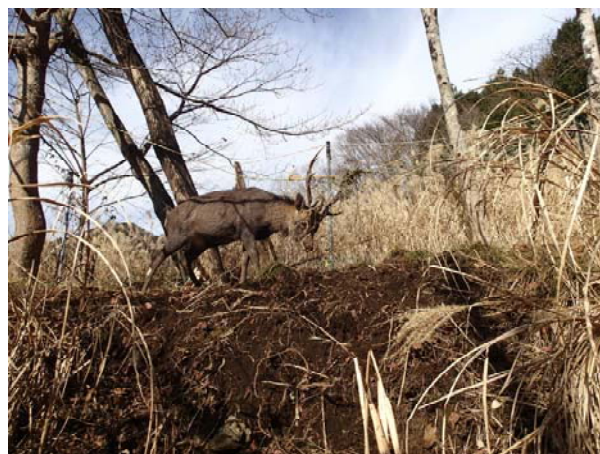
「ネットに絡んだオスジカ」