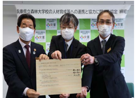
協定締結式の模様

また教育機関とこれまで以上に連携を密にするため、令和元年度には、管内9府県の教育機関等と「近畿中国森林管理局管内林業大学校等協議会」を設置し、情報共有・意見交換を行いました。