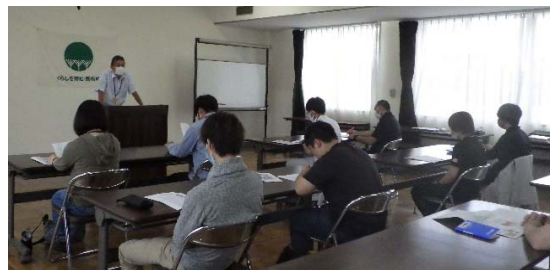
和歌山森林管理署長による講義

秋には研修生の実習のため、国有林野をフィールドとして提供する予定であり、引き続き農林大学校の活動に対し協力していきます。