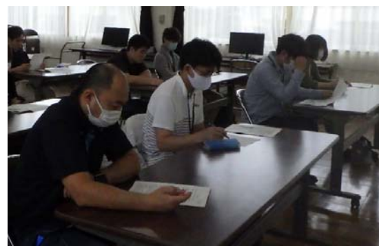
真剣に聴講する研修生の様子