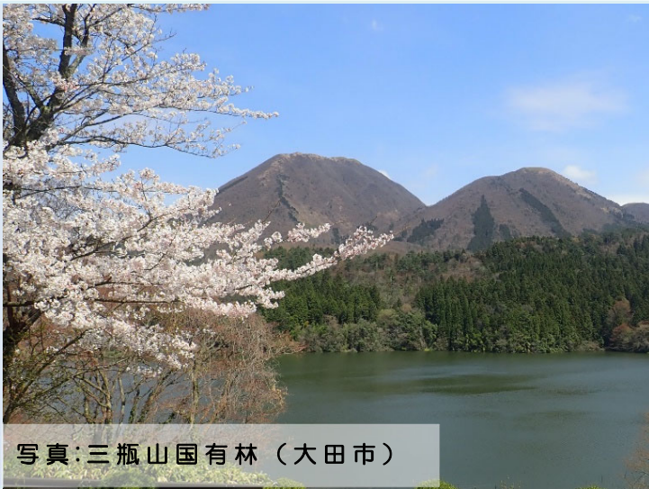
写真：三瓶山国有林（大田市）

令和6年度江の川下流森林計画区の森林計画の策定に先立ち、地域の皆様のご意見を参考とするため、地域懇談会と現地見学会を開催します。