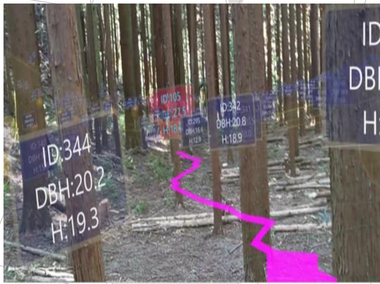
地上レーザスキャナによる森林調査 (スマートグラスによるデータ表示)

日時: 12/21 (木) 13:00~15:40 (受付: 12:30~) ※雨天の場合は、 12/22(金) に延期