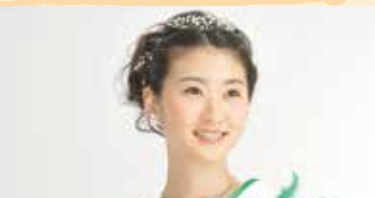
初代「ミス日本 みどりの女神」来場

会場: 近畿中国森林管理局・毛馬桜之宮公園 JR環状線「桜ノ宮駅」西口から徒歩5分