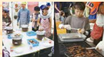
森の食材を活かしたフードコーナー