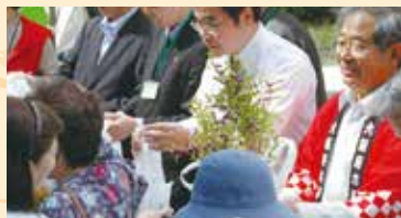
苗木プレゼント (数量限定、スタンプラリー制)