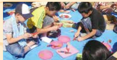
木と遊ぶキッズコーナー

主催: 水都おおさか森林づくり・木づかい実行委員会 協賛: 一般財団法人日本森林林業振興会大阪支部 / 一般社団法人全国燃料協会 後援: 国土交通省近畿地方整備局 / 近畿地方環境事務所 / 近畿農政局 / 三重県 / 滋賀県 / 京都府 / 奈良県 / 和歌山県 / 大阪市 / 大阪府 / 大阪府教育委員会 / 滋賀県森林組合連合会 / 京都府森林組合連合会 / 奈良県森林組合連合会 / 和歌山県森林組合連合会 / 滋賀県木材協会 / 一般社団法人京都府木材組合連合会 / 奈良県木材協同組合連合会 / 兵庫県木材業協同組合連合会 / 和歌山県木材協同組合連合会 / 内閣府公益社団法人大阪府猟友会 / 公益社団法人国土緑化推進機構 / 公益財団法人関西・大阪21世紀協会 / 公益財団法人国際花と緑の博覧会記念協会 / 帝国ホテル 大阪 / 産経新聞大阪本社 / 森林環境の保全・整備連絡調整会議