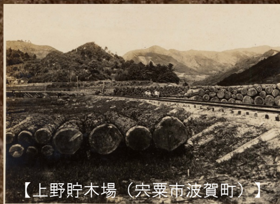
【上野貯木場（栄栗市波賀町）】