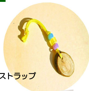
木の实ストラップ