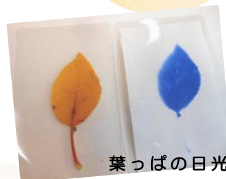
葉っぱの日光写真